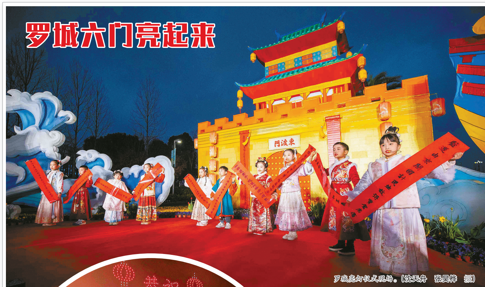
罗城亮灯仪式现场。

洋流体力学的数值模拟、海上风电结构动力学计算方法等领域取得了大量研究成果,指导“冲击与安全工程”教育部重点实验室通过验收。与此同时,托盖尔·摩恩教授充分发挥学术影响力,积极搭建宁波大学与国际知名高校和科研机构的合作桥梁,促进海洋力学领域的学术资源共享和科研成果转化,为宁波大学“双一流”学科建设作出杰出贡献。托盖尔·摩恩教授表示,很荣幸获得中国政府友谊奖,在与宁波大学长达45年的接触中,自己见证了中国社会特别是学术界跨越近半个世纪的巨大发展,并且深信这种发展还将持续下去。