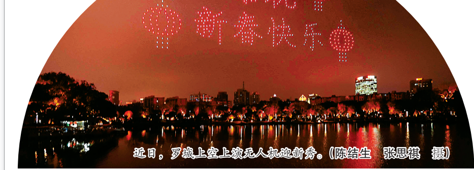
近日,罗城上空上演无人机迎新秀。

本报讯(记者沈天舟 通讯员裘保莉) 这几天,罗城六门以花灯形式重现,罗城内又新增一处打卡地标。此次布置的罗城六门花灯将保持一个半月,每日17时30分准时亮灯,市民和游客可以前往观赏,感受千年罗城的独特魅力与浓厚的节日氛围。罗城六门位于海曙区,分别为东渡门(地址:东门口时代广场)、和义门(地址:万豪酒店旁瓮城遗址)、永丰门(地址:永丰门遗址公园)、望京门(地址:望京门遗址博物馆门前)、长春门(地址:长春门文化公园)、灵桥门(地址:药行街与灵桥路交叉口)。