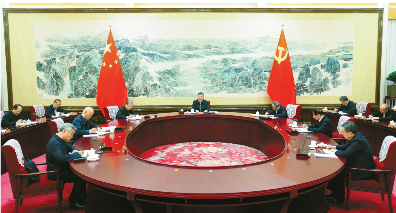
12月26日至27日，中共中央政治局召开民主生活会，中共中央总书记习近平主持会议并发表重要讲话。

新华社北京12月27日电 中共中央政治局于12月26日至27日召开民主生活会，深入学习贯彻习近平新时代中国特色社会主义思想，围绕巩固深化党纪学习教育成果、综合发挥党的纪律教育约束和