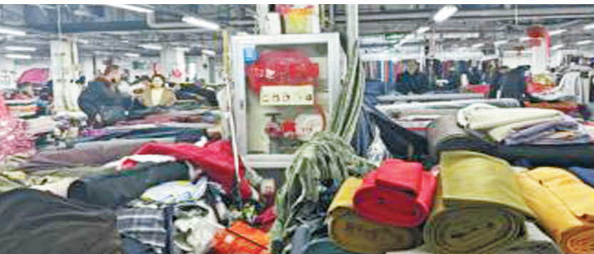
成堆的布料遮挡了消火栓。

横石桥市场位于鄞州区宋诏桥路与中兴南路交会处，这个市场内部有多个板块分区，售卖日用百货、副食品、布料、茶叶、板材等货品。