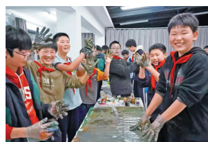
12月5日，宁波市中小学生学习成长计划“幸福巴士”驶入海曙区古林镇春蕾学校。本次活动围绕“幸福”展开，设置了五大主题环节，孩子们争先恐后地参与，整个校园充满了欢声笑语。

心理教师的专业辅导能力得到提升，并加强了医院和学校、医生和老师间的沟通交流，更好地护航中小学生学习心理健康。