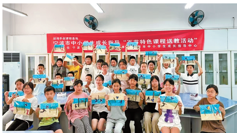
这是一堂小小拼布艺术家之“奔赴山海”劳动美育课，该课程是高校共建宁波市中小学生学习成长指导“百节特色课程送教活动”系列之一，由浙江纺织服装职业技术学院经手课程基地设计与执教，送教到位于石浦东门岛的象山海洋文化研学中心，来自象山县鹤浦中学和象山县金星学校的60余名初一学生参加了活动。

青少年心理健康教育社会关注度高，做精做准中小学生学习成长教育迫在眉睫，而学生的心理状态又容易受到多重变量的影响。早在3年前，市教育局就已谋建中小学生学习成长指导中心。宁波市将“未成年人心理健康关爱”定为2024年