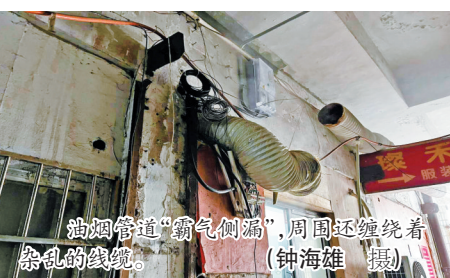
油烟管道“霸气侧漏”，周围还缠绕着杂乱的线路。

海曙新街商城地处宁波核心区，毗邻天一广场和城隍庙，曾是宁波青年一族时尚打卡地，如今也仍然是市民和外地游客观光购物胜地。