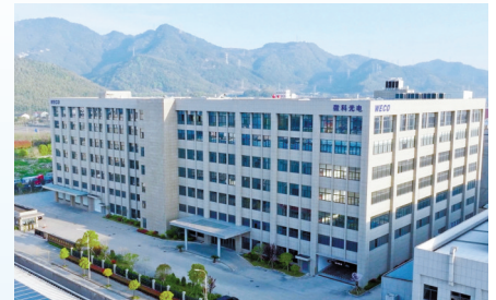
开投基金所投企业微科光电。

在具体措施上，我们将持续扩大开投基金管理规模，为后续投资布局奠定坚实的物质基础；持续提升资本运作的专业能力，培养打造具有凝聚力和战斗力的人才团队；健全风险管控机制，增强自身风控能力；打造市场化运作机制，提升经营管理水平，打造开投基金“专业、务实、高效”的文化品牌，为公司后续发展打下良好基础。