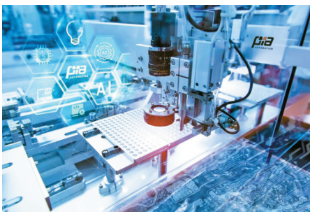
开投基金所投企业均普智能。