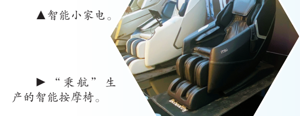
“秉航”生产的智能按摩椅。