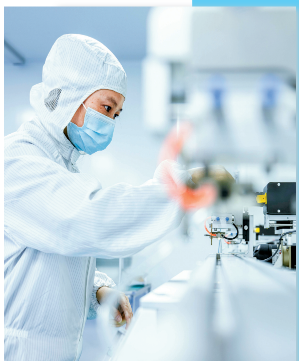
奉化康洋生命健康产业园内企业生产场景。