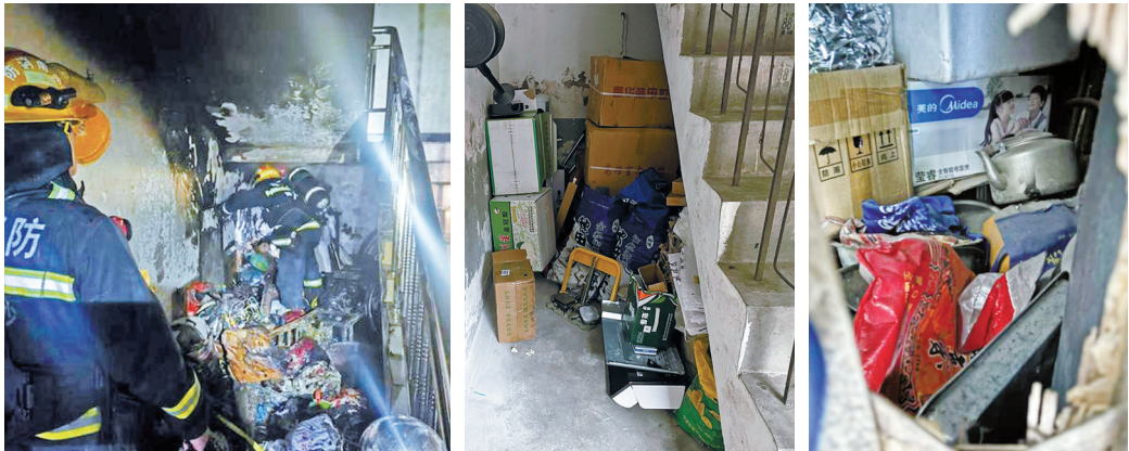
长沙着火点位于一楼楼梯间。 鄞州金家新村9幢一楼楼道堆满杂物。 海曙陶家巷26号楼道内堆满杂物。

纸箱、废弃塑料瓶、纸张、木料……走访中，记者发现一些小区楼道不同程度存在杂物乱堆放现象，安全隐患明显。虽然很多小区张贴有禁止堆放杂物的告示，但不少居民对这个告示熟视无睹。