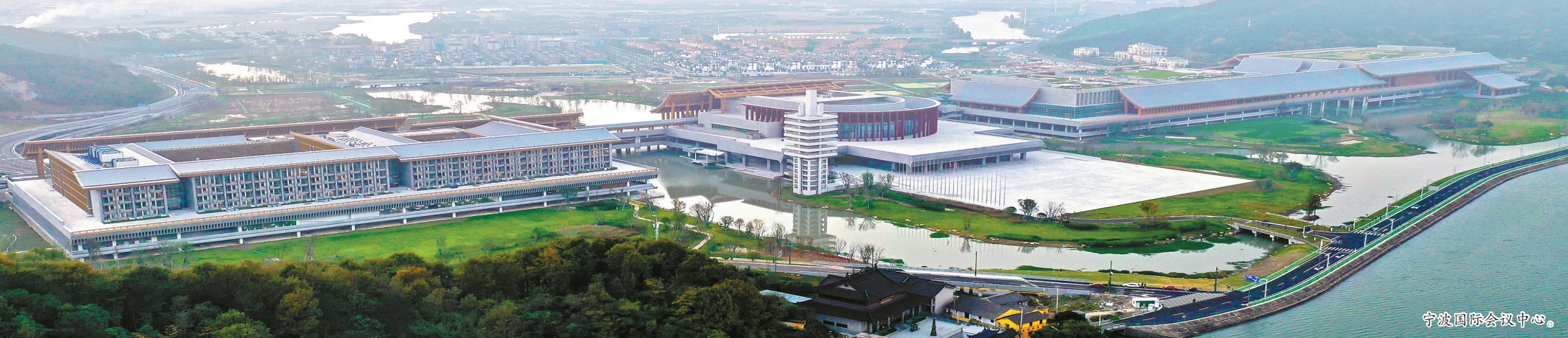
宁波国际会议中心。