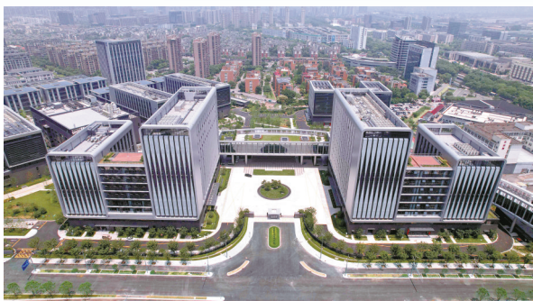
甬江实验室启动区。