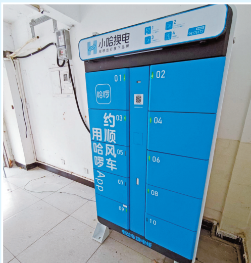
店内换电柜旁放置了灭火器,柜内未见消防安全设施。