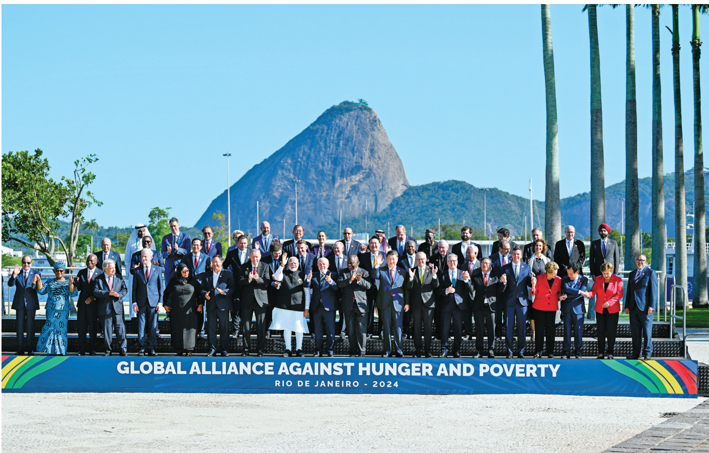
当地时间11月18日上午，国家主席习近平在巴西里约热内卢出席二十国集团领导人第十九次峰会。峰会把“构建公正的世界和可持续发展的星球”作为主题，并决定成立“抗击饥饿与贫困全球联盟”。这是习近平同与会领导人共同参加巴方发起的“抗击饥饿与贫困全球联盟”合影。

新华社里约热内卢11月18日电（记者倪四义 姜岩）当地时间11月18日上午，国家主席习近平在巴西里约热内卢出席二十国集团领导人第十九次峰会。在峰会第一阶段围绕“抗击饥饿与贫困”议题讨论时，习近平发表题为《建设一个共同发展的公正世界》的重要讲话。习近平指出，当今世界百年变局加速演进，人类发展面临的机遇和挑战前所未有。作为世界主要大