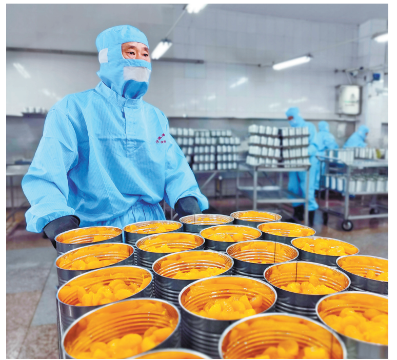
水果罐头生产现场。

为助力农食产品“出海”，镇海海关做好核查监管，根据各进口国对农食产品的品质要求，对企业加工车间、包装车间、原辅料控制体系等进行逐项指导，开展全过程质量安全监管，为出口食品安全保驾护航。