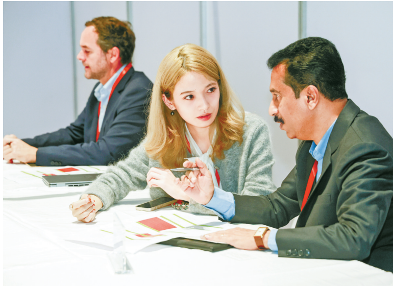
企业与采购官对接。

联合国采购是国际公共采购的重要组成部分，是中国企业参与国际竞争公认的试验场和加速器，被