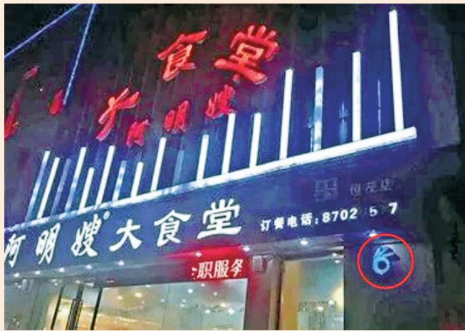
2019年，阿明嫂大食堂店门口挂着蓝色“OK”标志。（资料图）

不少市民表示，有“OK”标志的店铺现在数量、点位不明，存在明明门口有标志却不让市民如厕的情况，这体现出管理上的不足。大家希望有关部门能够加强管理并加大宣传，确保更多市民能够知晓并使用这一便民设施。