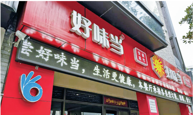
好味当餐厅门前挂着“OK”标志。