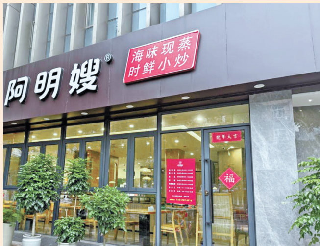
店铺重新装修后“OK”标志不见踪影。