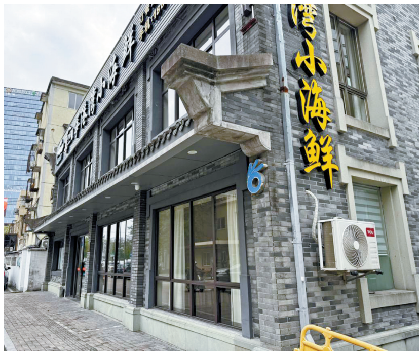
餐厅停业两个月，门前挂着“OK”标志。