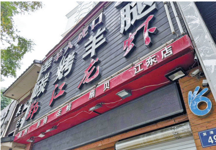
鄞州一餐饮店转手后门口仍留着“OK”标志，现任经营者表示不知其含义。