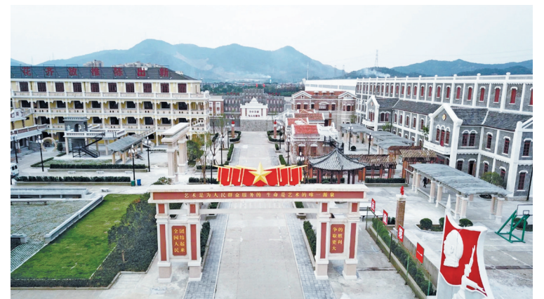
宁波现代影视产业园。

“接下来，宁波将继续实施项目招引推进行动，坚持‘招大引强’，梳理文旅产业重点招引方向，大力引进优质文旅企业，储备大型主题公园等重大支撑性项目。”市文化广电旅游局有关负责人说。