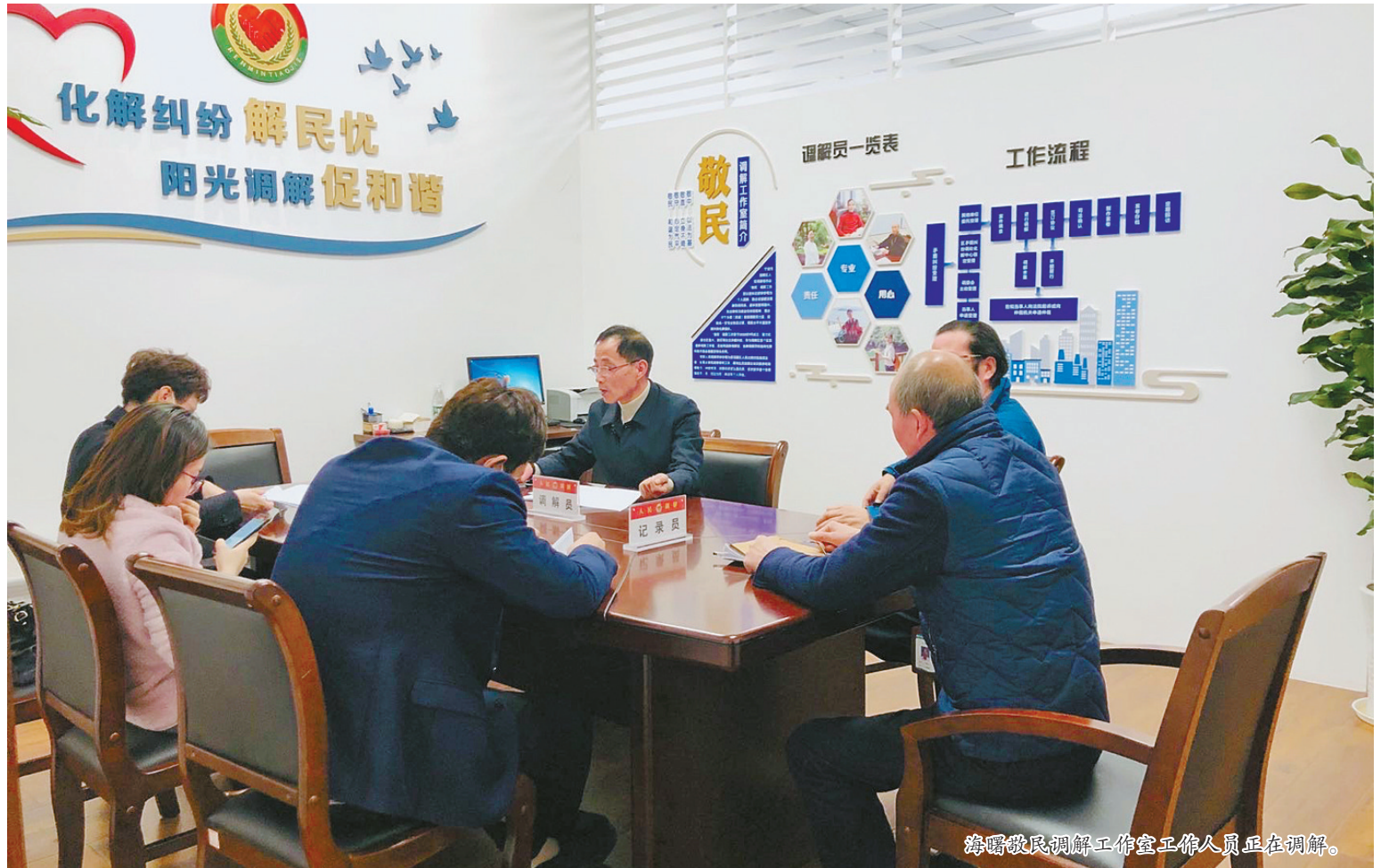
海曙区民调工作室工作人员正在调解。

调解是具有中国特色的非诉讼纠纷解决方式，被国际社会誉为“东方之花”。近年来，宁波坚持和发展新时代“枫桥经验”，发挥法治的引领和规范作用，与时俱进探索创新，不断夯实调解基层基础，创新推出“网格融调”“巡回调解”“随警解纷”等具有宁波辨识度的调解模式，推进调解国际化试点、诉前调解改革、涉企调解服务增值，构建完善大调解工作格局，形成了以人民调解为引领的多元调解工作格局，为打造法治中国先行市、建设现代化滨海大都市提供坚实支撑。