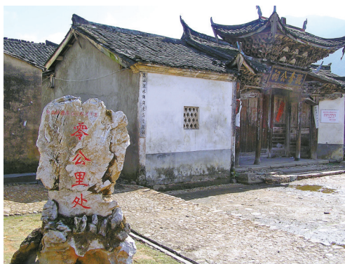
汀江(鄞江)流经的福建长汀县钟屋村观寿公祠，为红军长征的起点。

这些文献都清晰表明，鄞江就是现在的甬江。古代文人诗中常常以鄞江指代甬江流域，如宋代舒宣有诗《题鄞江》，元代高僧笑隐大珙有诗：“鄞江水急东流去，太白峰高不到天。”