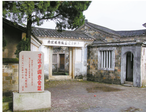
汀江(鄞江)流经福建上杭县，沿岸有土地革命时期毛泽东才溪乡调查会址。