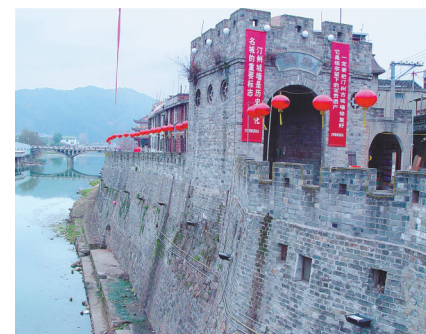
福建长汀县古城墙，城墙下就是当年红军越过的汀江(鄞江)。

古籍中还有众多用鄞江称呼奉化江的记载。《古今图书集成·职方典·宁波府城池考》称：“东津浮桥，在县治东灵门外，跨鄞江。”《大清一统志》卷105说得更清楚：“东津浮桥，在府城东门外，旧名灵桥，跨鄞江。”东津浮桥是今奉化江上灵桥的前身。唐长庆三年(823年)，为有利于江东的开发，当时的明州刺史应彪在城东奉化江上，用16条木船架起宁波第一座跨江浮桥。宋宝庆《四明志》卷3中提到，当时沿鄞江即奉化江的城门有甬水门、鄞江门、灵桥门，灵桥门上有鄞江楼。