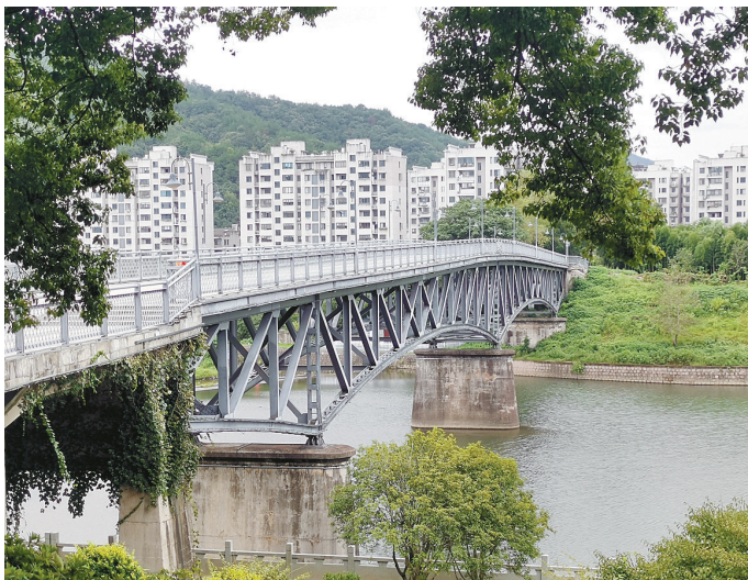
奉化溪口翠屏山(飞凤山)下刻江一角。刻江是奉化江之源，也是甬江的源头之一。

明代以后，宁波的地方志均记载，鄞江镇曾是明州的州治、鄞县的县治。但这个说法存在争议，且没有考古方面的证据。明成化《四明郡志》称明州州城“北临鄞江，地形鄙狭”，故于唐长庆元年(821年)迁治三江口。后人据此作为明州州治从鄞江迁往三江口的重要证据。但实际上，古代“鄞江”的称谓并不限于今鄞江，它指的是包括甬江、奉化江、慈溪江(今姚江)在内的整个甬江流域。