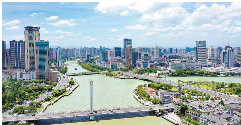
宁波城区三江口，旧时三江统称鄞江。

值得一提的是，鄞江之名，还与千里之外的闽西汀江有着千丝万缕的联系。宁波的先民极有可能早于中原客家人迁徙到了那边。