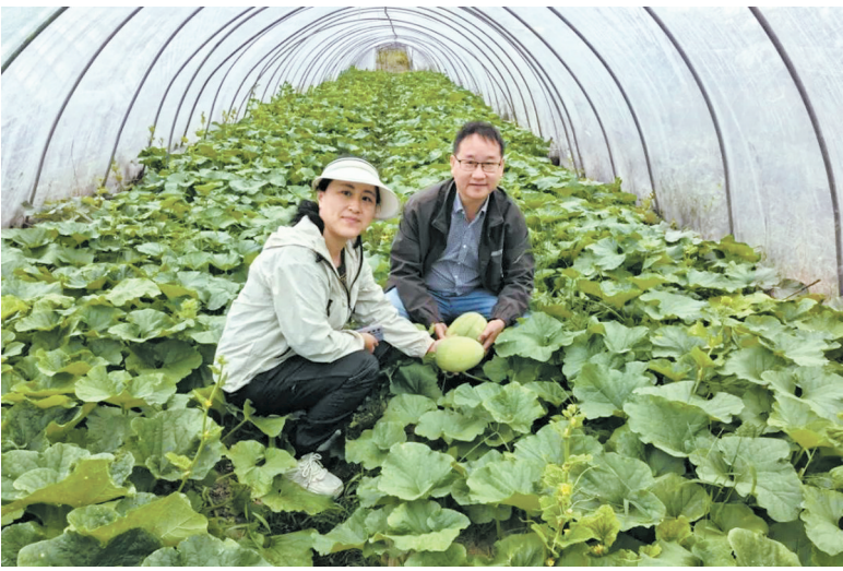
科研人员在察看甜瓜长势。