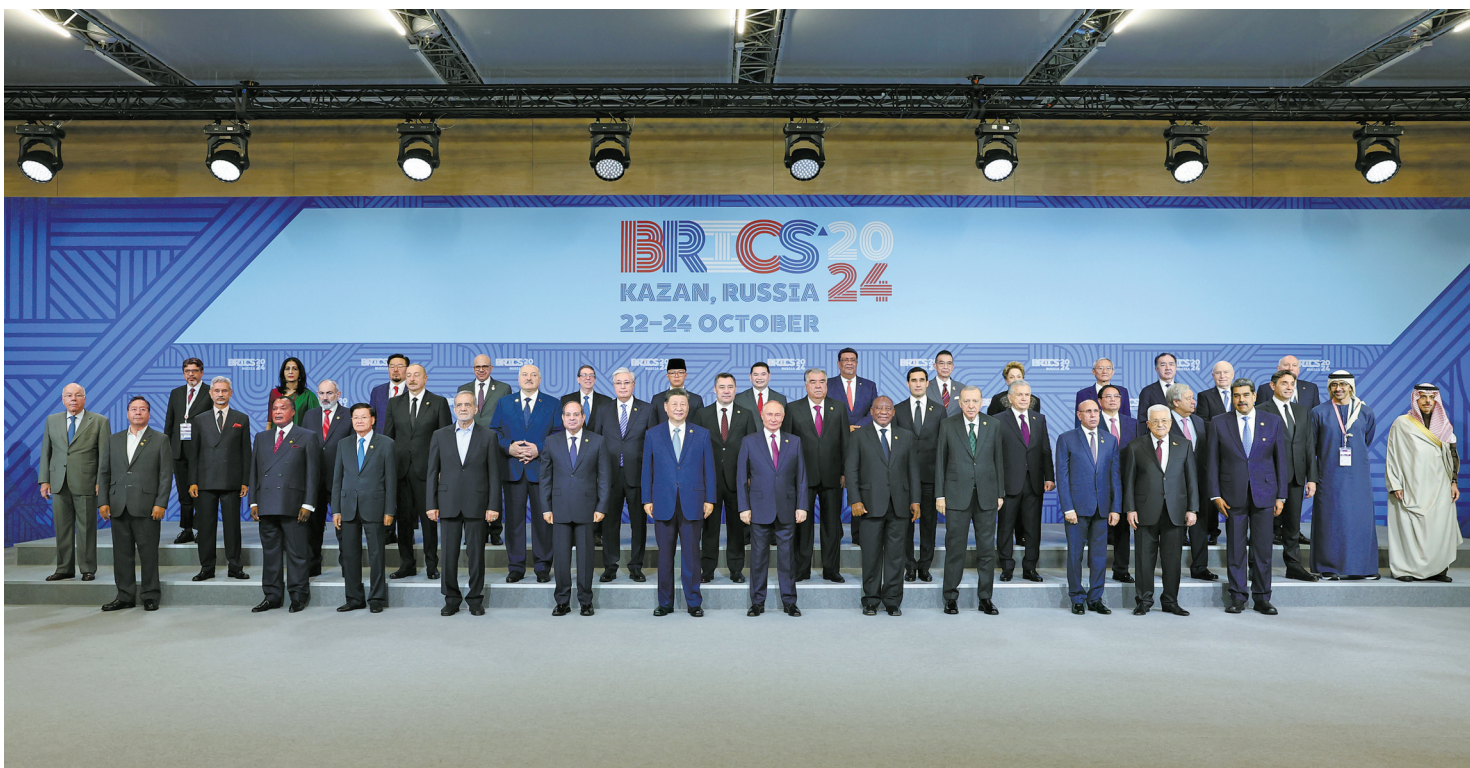
当地时间10月24日上午，国家主席习近平在喀山会展中心出席“金砖+”领导人对话会并发表题为《汇聚“全球南方”磅礴力量 共同推动构建人类命运共同体》的重要讲话。这是出席对话会的金砖国家及嘉宾国领导人或代表、国际组织负责人集体合影。

■ 坚守和平，实现共同安全 ■ 重振发展，实现普遍繁荣 ■ 共兴文明，实现多元和谐