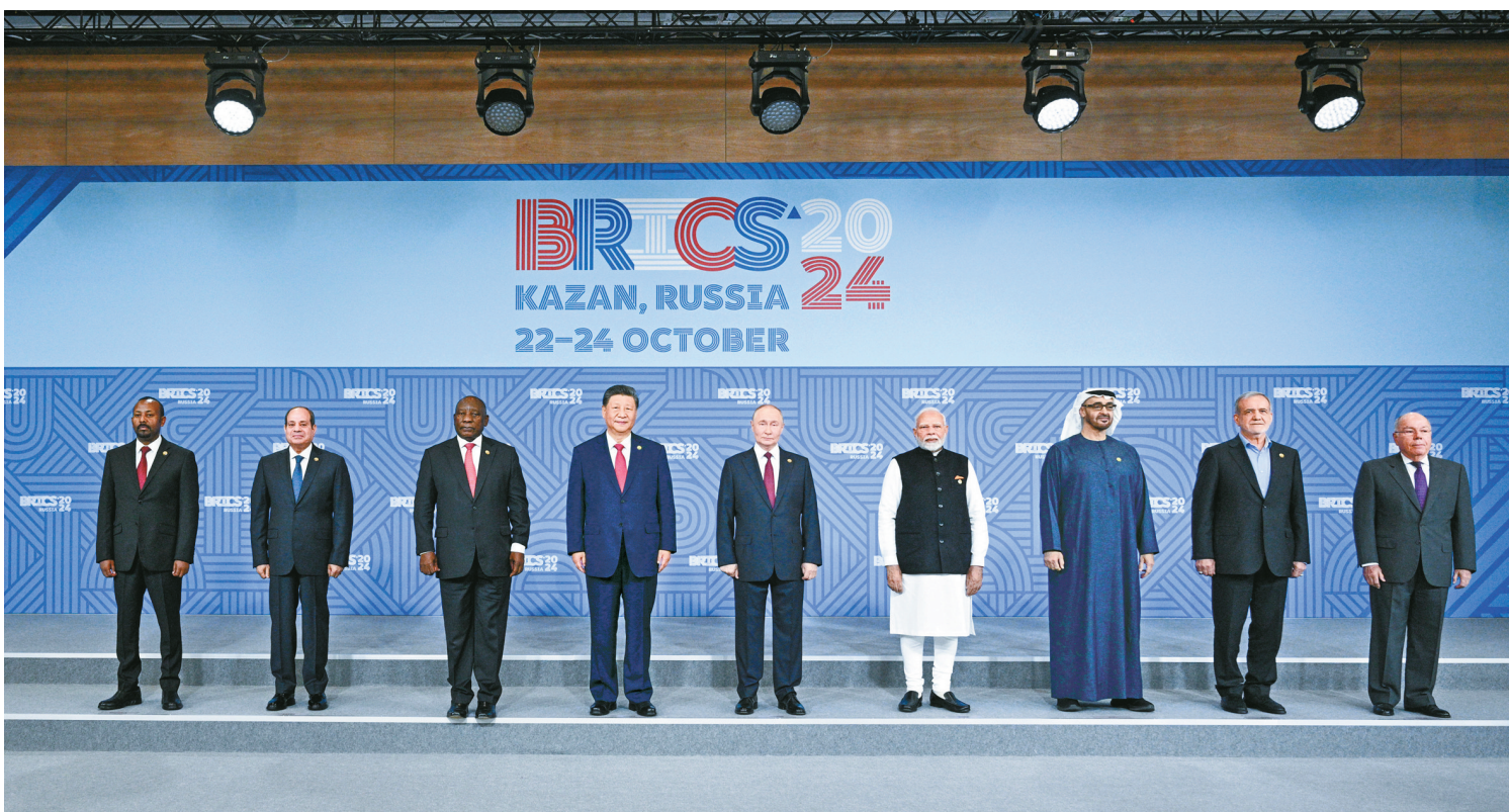
当地时间10月23日上午,金砖国家领导人第十六次会晤在喀山会展中心举行。这是会晤期间,金砖国家领导人集体合影。