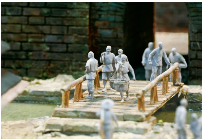
宁波塘河文化陈列馆一景。

除了天然的三条江外，还有人工挖掘的“六塘河”。“古书讲，越人以船为车，以楫为马”，水路交通是江南生活的重要组成部分。”周东旭说，“三江六塘河，一湖居城中”的甬城水系格局，不仅为城市提供了丰富的水资源，也作为大