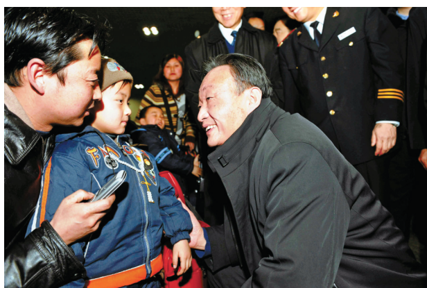
2008年2月3日，吴邦国同志在北京西站候车室与旅客交谈。

2002年11月，吴邦国同志在中共十六届一中全会上当选为中央政治局委员、常委。2003年3月，在十届全国人大一次会议上，他当选为全国人民代表大会常务委员会委员长，同月任全国人大常委会党组书记。2007年10月，他在中共十七届一中全会上再次当选为中央政治局委员、常委。2008年3月，在十一届全国人大一次会议上，他再次当选为全国人民代表大会常务委员会委员长，同月任全国人大常委会党组书记。他认真贯彻落实党中央决策部署，坚持正确政治方向，依法履行职责，不断增强工作实效，进一步丰富和发展人民代表大会制度的理论和实践，为发展社会主义民主、健全社会主义法制作出重要贡献。他强调，发展社会主义民主政治，必须把坚持党的领导、人民当家作主和依法治国有机统一起来，坚持和完善人民代表大会制度这一根本政治制度，必须坚持党的领导，决不能削弱党的领导、脱离党的领导、放弃党的领导，决不能搞西方那种多党制、议会制，中国对自己选择的政治发展道路要理直气壮地宣传，坚决抵制各种错误思潮影响。