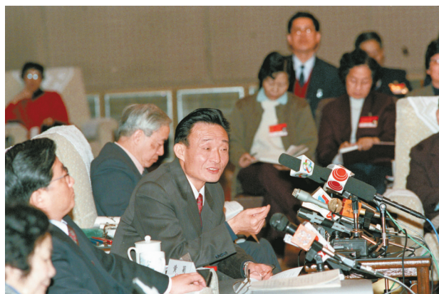
1994年3月，时任上海市委书记的吴邦国同志在全国两会上海代表团全团会议上。

在分管基础设施建设工作中，吴邦国同志坚持统筹规划、突出重点、合理布局、质量第一，集中力量建成一批关系全局的重大基础设施，切实增强我国经济发展后劲。他始终情系三峡、关心三峡，对三峡工程质量保障、重大装备国产化、三峡总公司转型发展等进行具体指导，扎实做好移民安置工作，为优质高效建设三峡工程作出突出贡献。他坚持把公路建设放在党和国家事业发展的全局来谋划和推进，明确我国公路发展战略、规划、技术标准和管理体系等重大问题，推动公路建设驶入快速发展轨道。他着力推进铁路建设和发展，坚定支持铁路大提速，推动京九、南昆等铁路全线投入运营，青藏铁路开工建设，开创铁路工作新局面。他大力支持上海洋山深水港立项建设，为打造上海国际航运中心发挥重要作用。他高度重视邮电通信建设，有力推进移动通信网跨越式发展，推动长途光缆线路建设空前快速发展。