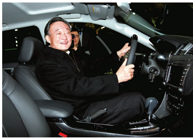
2010年1月30日，吴邦国同志在上海汽车集团股份有限公司技术中心察看新能源样车。

吴邦国同志是中国特色社会主义民主法治建设的重要领导者。他强调，如果没有比较完备的、高质量的法律法规，就谈不上实现社会主义民主政治的制度化、规范化和程序化，就谈不上依法治国、建设社会主义法治国家。在党中央领导下，他将立法工作作为全国人大及其常委会的首要任务，紧紧围绕党中央确定的立法工作主题，坚持科学立法、民主立法，适应社会主义市场经济发展、社会全面进步和加入世贸组织的新形势，把中国特色社会主义法律体系中基本的、急需的、条件成熟的法律作为立法重点，抓紧制定修改相关法律，集中开展法律清理工作。2003年3月，他担任中央宪法修改小组组长，在中央政治局常委会领导下主持宪法修改工作。由十届全国人大二次会议通过的宪法修正案，确立了“三个代表”重要思想在国家政治和社会生活中的指导地位，明确国家尊重和保障人权、依法保护公民的私有财产权和继承权等内容，对促进我国经济社会发展、推进中国特色社会主义民主法治建设具有重要意义。在他的主持下，第十届、十一届全国人大及其常委会共审议通过宪法修正案草案、法律草案、法律解释草案和有关法律问题的决定草案186件，包括物权法、企业破产法、企业所得税法、公务员法、行政许可法、治安管理处罚法、劳动合同法、未成年人保护法、妇女权益保障法、关于加强网络信息保护的决定等。 【下转第8版】