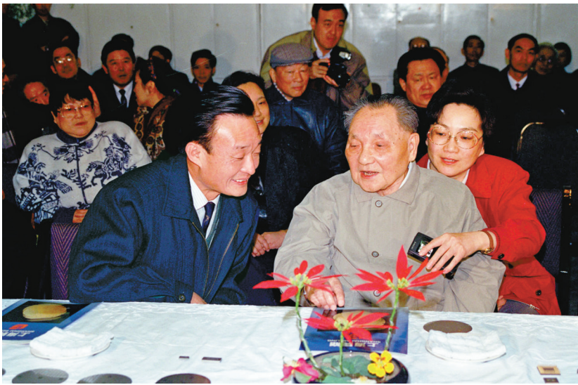
▲1992年2月10日，邓小平同志在上海贝岭微电子制造有限公司参观时与吴邦国同志交谈。