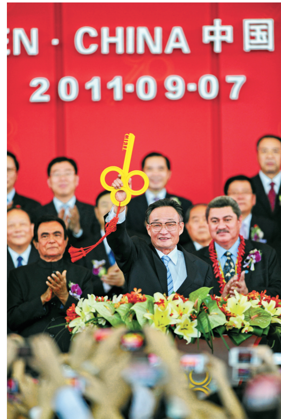
2011年9月7日，吴邦国同志在福建厦门出席第十五届中国国际投资贸易洽谈会开幕式。