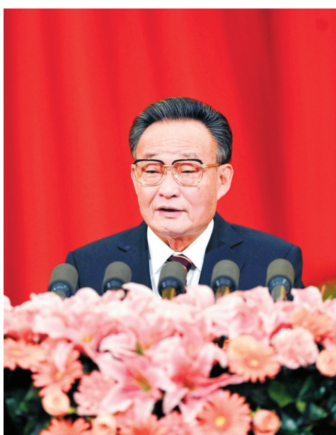
二〇一一年三月十日，十一届全国人大四次会议在北京人民大会堂举行第二次全体会议。吴邦国同志作全国人大常委会工作报告。