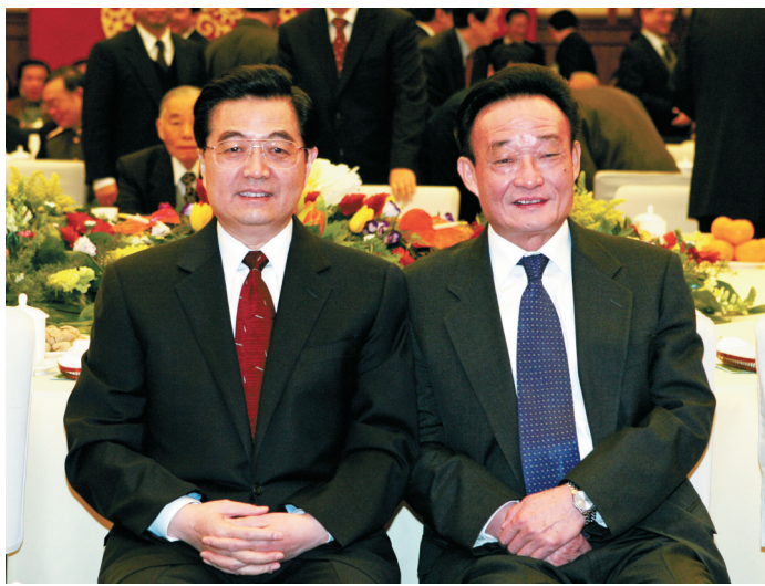
二〇〇五年一月一日，全国政协在北京举行新年茶话会。这是胡锦涛同志与吴邦国同志在一起。