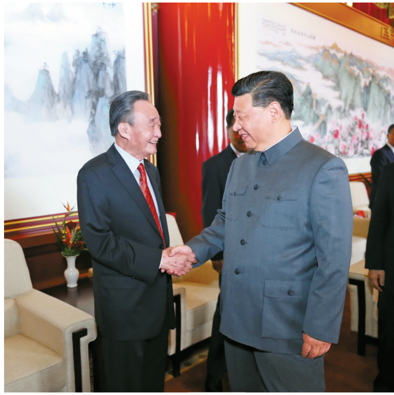
▶2021年7月1日，庆祝中国共产党成立100周年大会在北京天安门广场隆重举行。这是庆祝大会前，习近平同志与吴邦国同志握手。