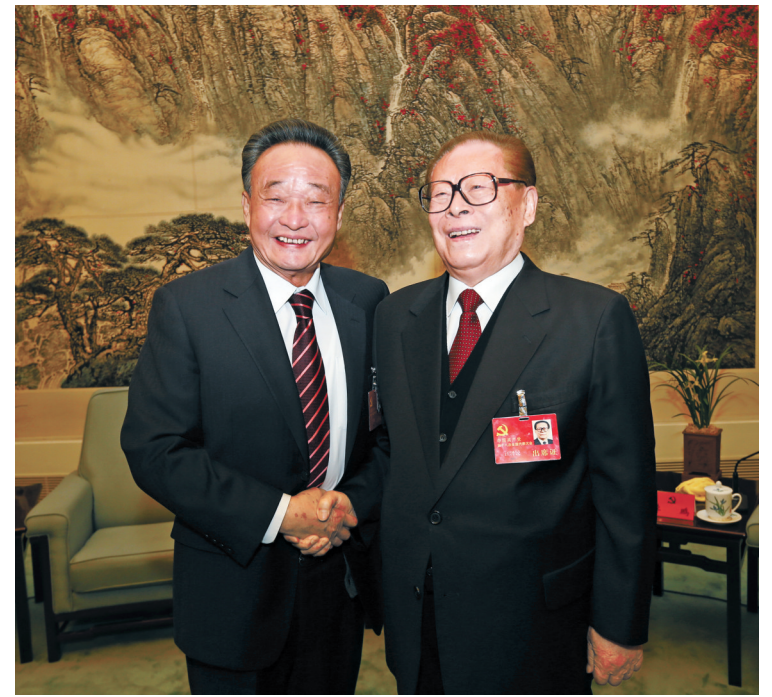
2012年11月14日，中国共产党第十八次全国代表大会在北京闭幕。这是闭幕会前，江泽民同志与吴邦国同志在一起。