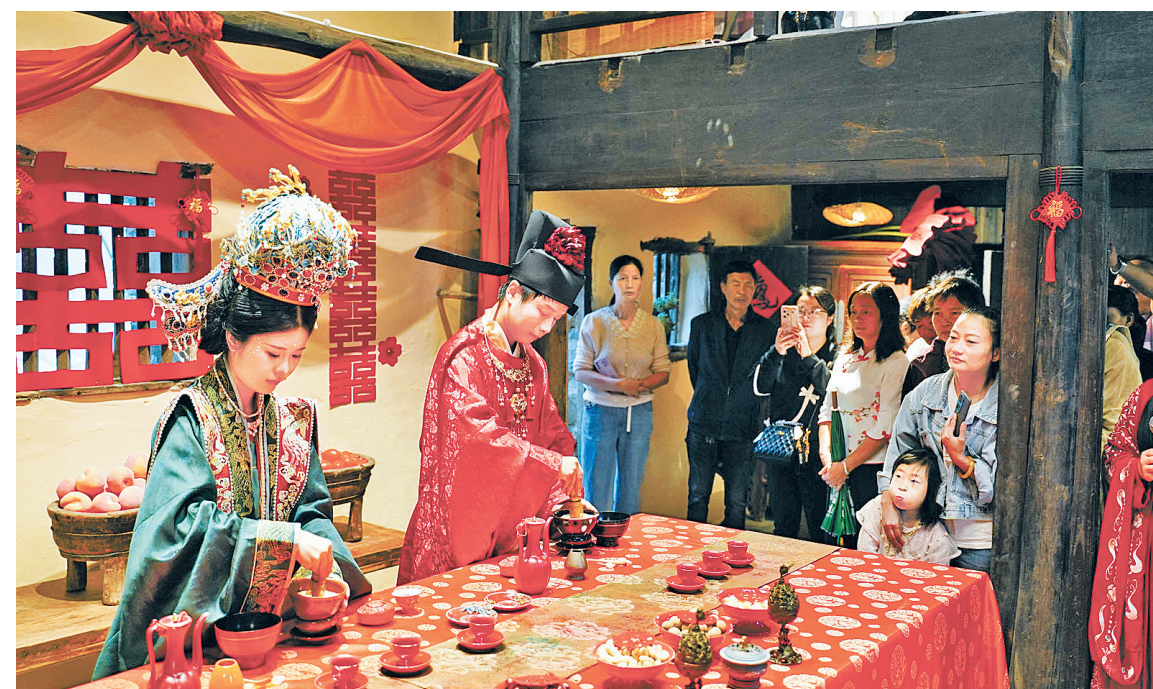
婚茶表演现场。