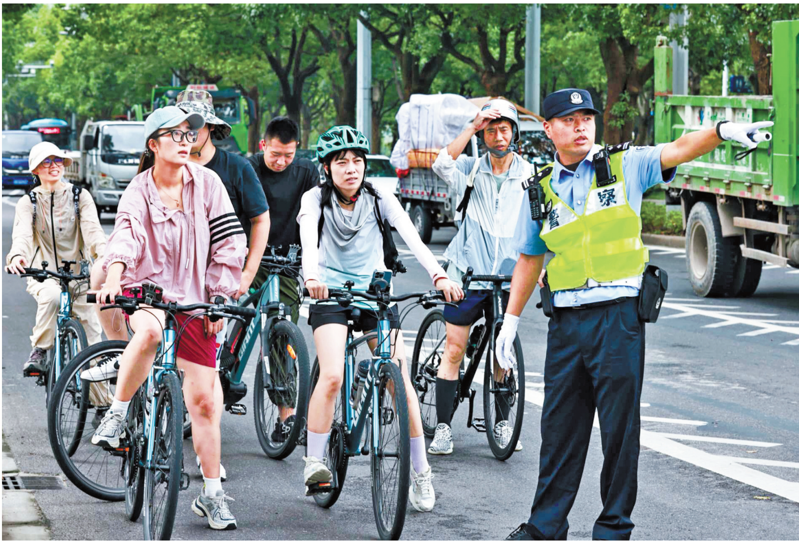
民警在给游客指路。