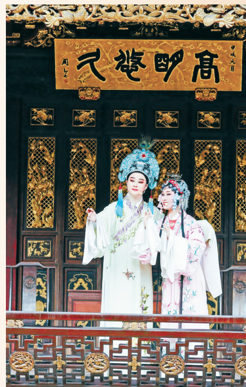
经典折子戏上演。

越剧唱罢，宁波走书唱起 10月6日下午，在天一阁博物院，一场精彩纷呈的非遗曲艺音乐会在修缮一新、流光溢彩的秦氏支祠古戏台上演。