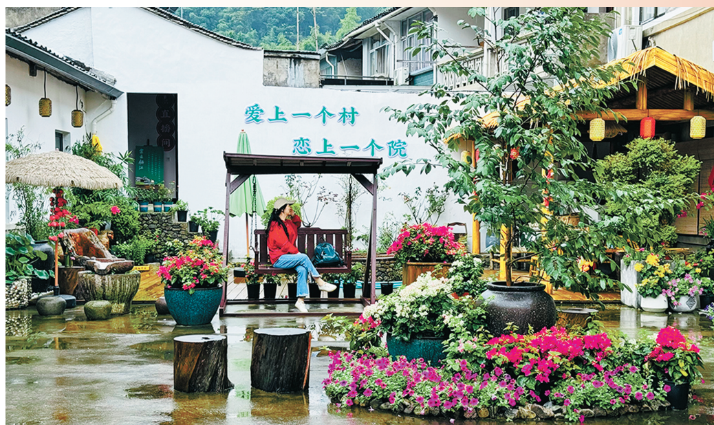
“棠云栖江·共享小院”。