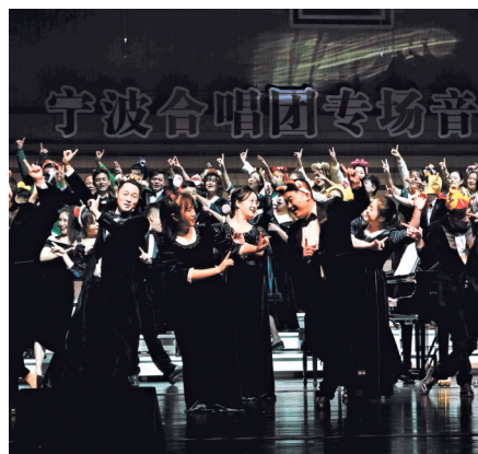
宁波合唱团专场音乐会。

宁波市文化馆相关负责人表示，这次宁波合唱团亮相国家大剧院，是一个新的起点。接下来，宁波合唱团计划推出更多具有宁波特色的原创作品，将宁波的地域文化和时代精神融入音