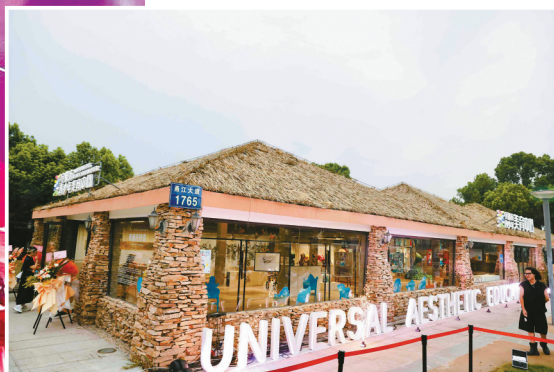
宁波市青少年美育中心已于今年8月正式启用。