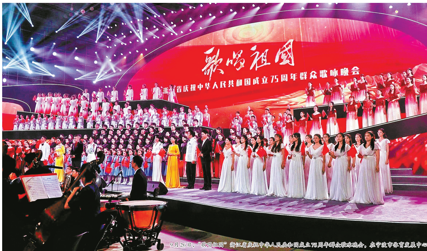
9月26日，“歌唱祖国”浙江省庆祝中华人民共和国成立75周年群众歌咏晚会，在宁波市体育发展中心体育馆举行。