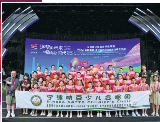
在深圳举行的2024“全民美育”青少年民族合唱展演展示活动中，宁波呐豆少儿合唱团获得最高荣誉。