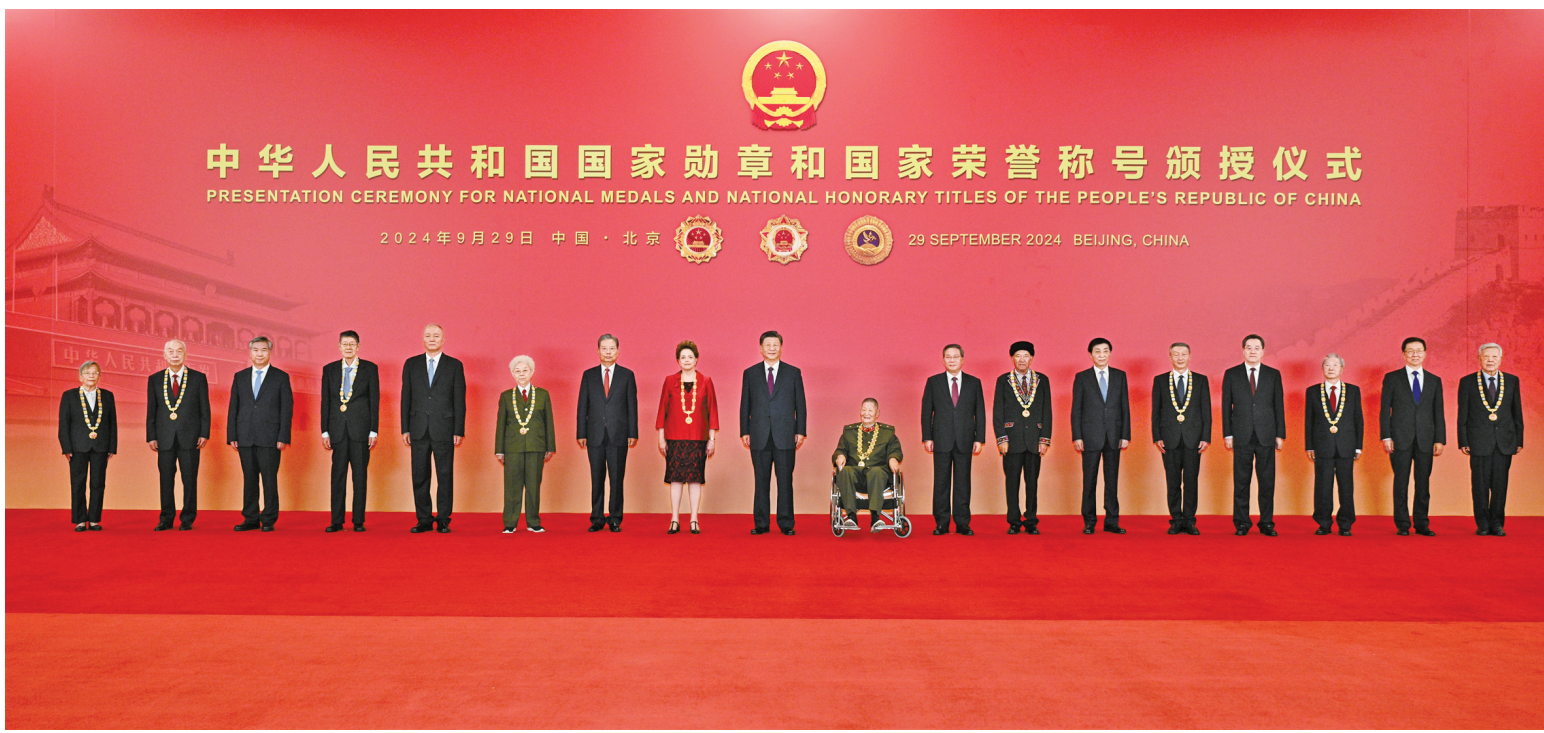
9月29日，中华人民共和国国家勋章和国家荣誉称号颁授仪式在北京人民大会堂金色大厅隆重举行。习近平等领导同志同国家勋章和国家荣誉称号获得者合影留念。

新华社北京9月29日电 中华人民共和国国家勋章和国家荣誉称号颁授仪式29日上午在北京人民大会堂金色大厅隆重举行。中共中央总书记、国家主席、中央军委主席习近平向国家勋章和国家荣誉称号获得者颁授勋章奖章并发表重要讲话。