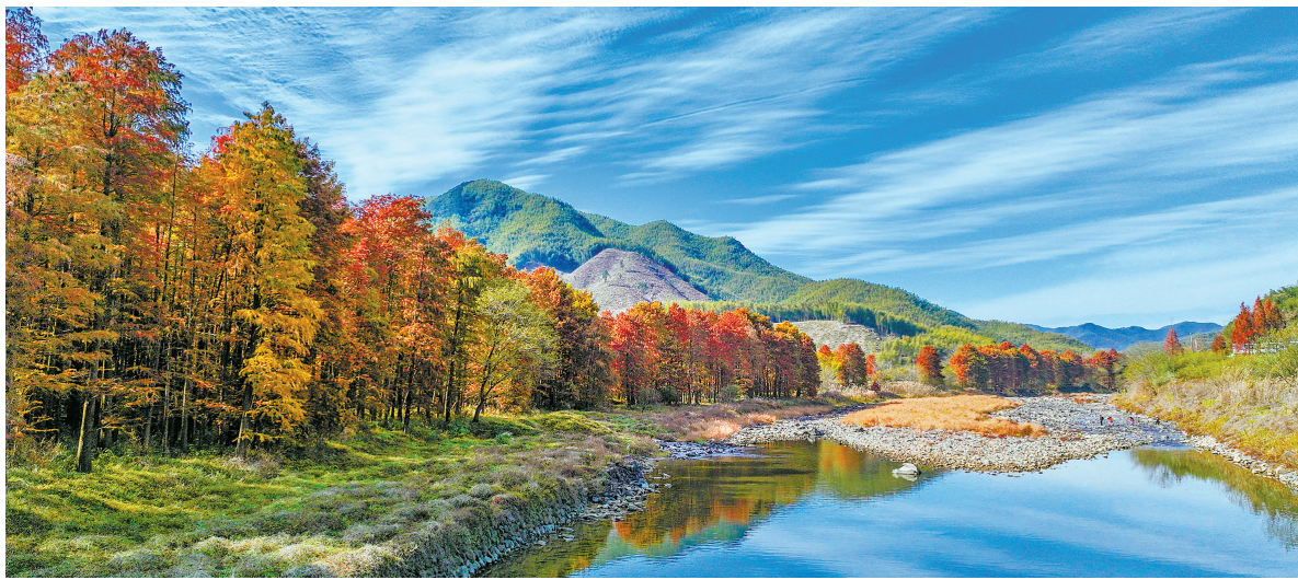
秋美四明乡村观光线路上的童家村水杉林。

蛟口水库的北翼，下辖小皎、王岙、董家、孔家四个自然村落，森林覆盖率80%以上。村落依山而建，竹林、红杉相映成趣，环境清幽。 近年来，宁波市创新发展乡村新产业新业态，因地制宜发展观光农业、乡村旅游、民宿经济，不断延伸农业的产业链、价值链。此前奉化区桃花盛开开美景美食体验线、江北区休闲文化乡村游、宁海县桑洲屿南山岗精品线等线路已入围中国美丽乡村休闲旅游精品线路。