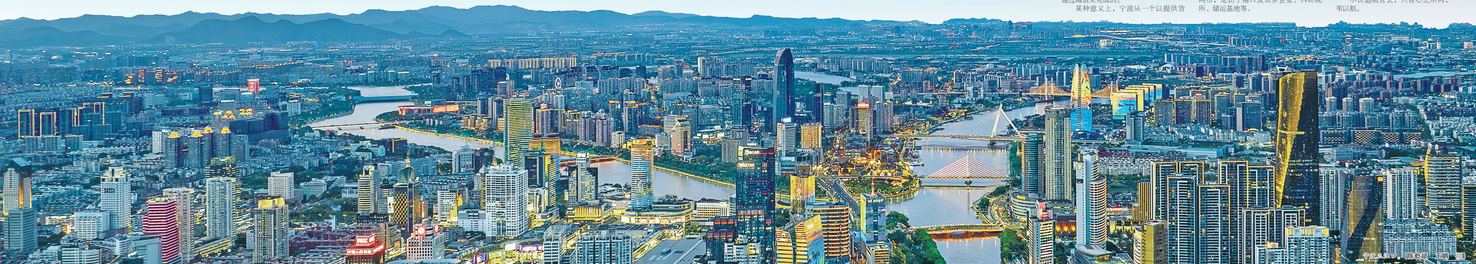
宁波夜景。

在宁波的座谈会一直开到夜幕降临，还意犹未尽。 “海洋是高质量发展战略要地”。当前，以海洋为主体的技术、信息、市场等领域的交流愈加紧密，开发海洋、经略海洋，成为什么崛起的必然抉择。 调研组为什么直奔“浙”里，又为什么选中甬舟？ 浙江对海洋的经略开始早、规格高。建设海洋强省，是习近平同志在浙江工作期间亲自谋篇布局、亲自开篇破题的一篇大文章。 习近平同志在浙江工作期间，将“进一步发挥浙江的山海资源优势，大力发展海洋经济”作为“八八战略”的重要内容之一，为浙江海洋强省建设指明了方向。 20多年来，浙江坚持一张蓝图绘到底，全省域、全方位、系统性推进海洋强省建设。 其中，宁波与舟山不仅优势互补，作为浙江经略海洋的“排头兵”，两城无论是在港城布局、产业优化、开放创新，还是生态保护、文旅联动等方面，均大有可为，大有作为、大有能力，亦能为我国建设海洋强国、谱写海洋文明新篇章提供“浙江解法”“浙江智慧”。 具体到宁波，更深层的自我期许是，积蓄向海图强的发展动能，释放海洋文明的生产力。 在新发展格局的背景下，壮大海洋战略性新兴产业，加快海洋科技创新、海洋资源开发、港口物流建设，大力推动科创力量和产业资源融合聚合，做大做强蓝色经济，不断增强海洋福祉，在发展海洋新质生产力上争一流、挑大梁。同时坚持安全护航，完善海洋综合治理体系，让浩瀚相通的海域造福子孙后代。 蓝色星球上，脉动穿越千年，激荡着向海而行、向海而兴的世代夙愿。而今，我们正向着深蓝启航。 不畏阻且长，只管心之所向，一苇以航。