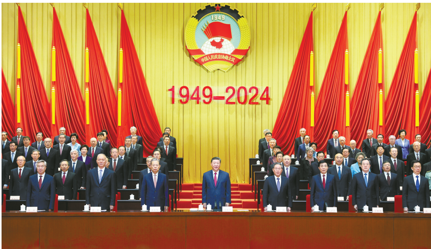
9月20日上午，中共中央、全国政协在全国政协礼堂隆重举行庆祝中国人民政治协商会议成立75周年大会。习近平、李强、赵乐际、王沪宁、蔡奇、丁薛祥、李希、韩正等出席大会。

新华社北京9月20日电 中共中央、全国政协20日上午在全国政协礼堂隆重举行庆祝中国人民政治协商会议成立75周年大会。中共中央总书记、国家主席、中央军委主席习近平出席大会并发表重要讲话。他强调，我们要更加坚定道路自信、理论自信、制度自信、文化自信，在发展新质生产力中把人民政协的显著政治优势更加充分发挥出来，不断巩固和发展生动活泼、安定团结的政治局面。