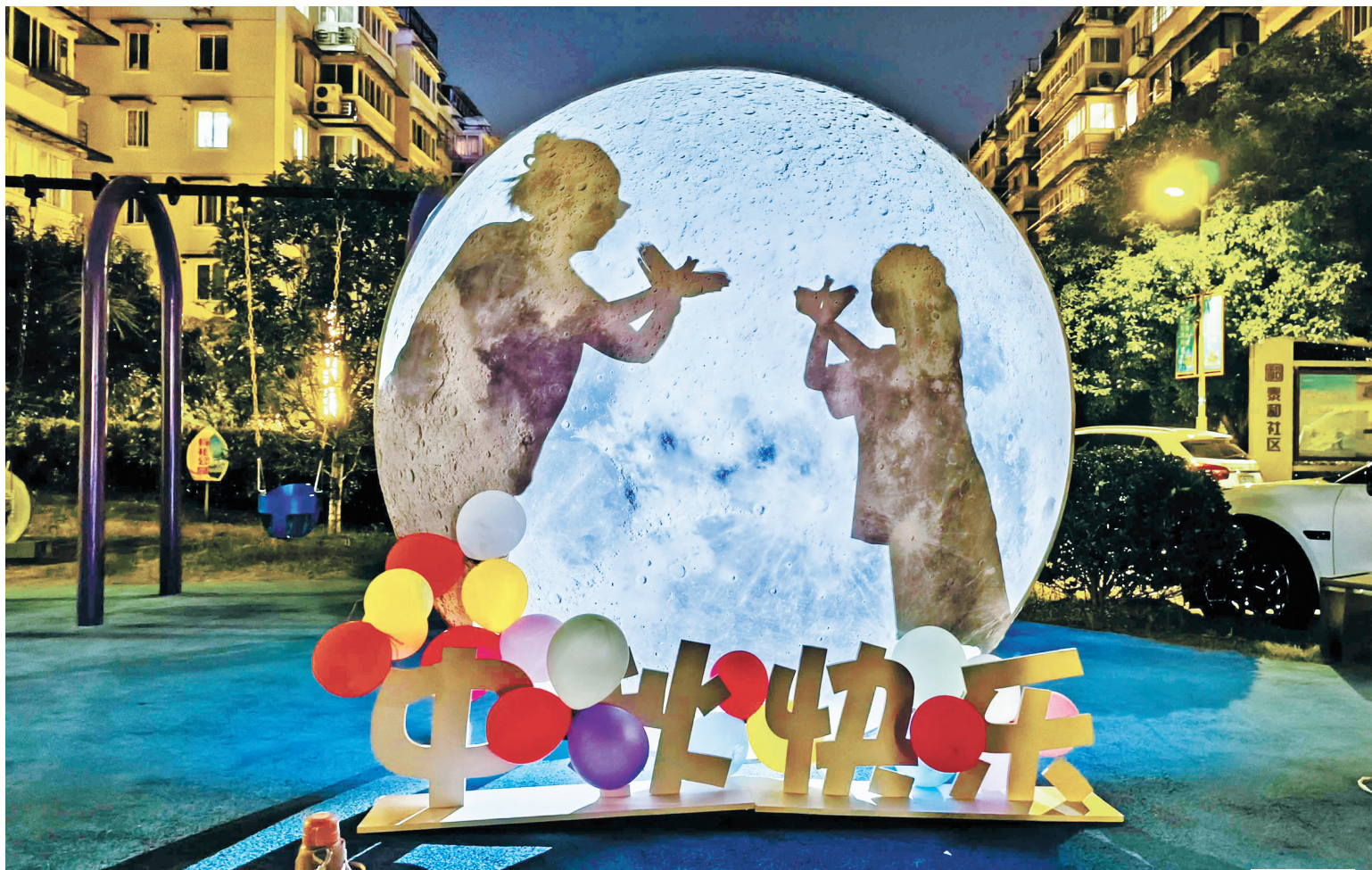
花好月圆人长久。这两天，鄞州东胜街道泰和家园小区广场上的3个巨大的“超级月亮”，在夜色的映衬下显得十分绚丽，居民争相在“超级月亮”前拍照留念。