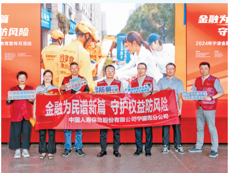
2024年宁波金融消费者权益保护教育宣传月活动。