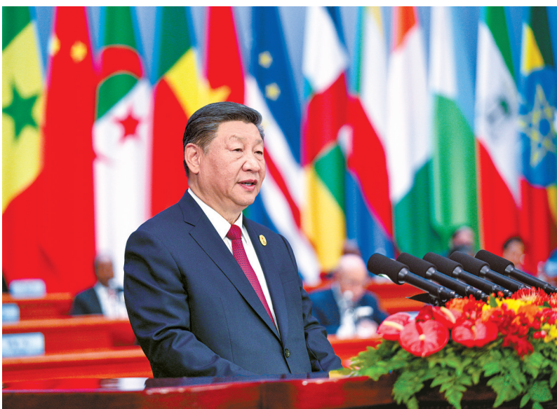
9月5日上午，国家主席习近平在中非合作论坛北京峰会开幕式上发表题为《携手推进现代化，共筑命运共同体》的主旨讲话。

宣布中国同所有非洲建交国的双边关系提升到战略关系层面，中非关系整体定位提升至新时代全天候中非命运共同体