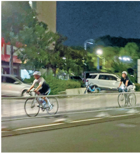
两名骑友骑行速度较快。