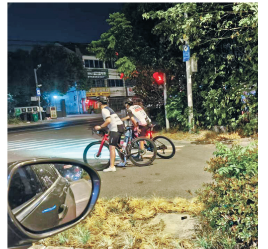
海曙区望童路一路口，骑行者在耐心等待红灯。

在采访中记者了解到，种种不文明骑行行为产生的原因也比较复杂，需要客观分析和认识。