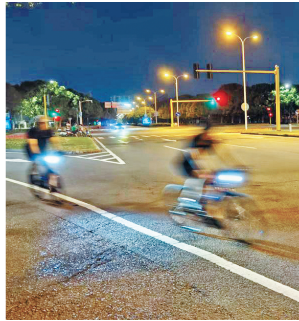
骑行者闯红灯通过金达路诚信路口。

“要做到安全、快乐骑行，不追求速度、保持良好的沟通很重要，不管是机动车、自行车，还是行人，做到相互礼让和感恩是快乐的源泉。”他说，根据他的组团骑行经验，一个礼让的动作，一个友好的手势，一个善意的眼神和笑脸，就会化解许多因路况不好导致的情绪不满，让骑行环境瞬间变得更可亲起来。