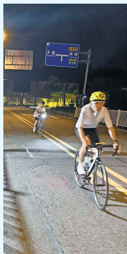
骑友沿着非机动车道骑行。