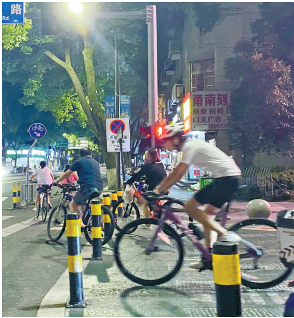
不少骑友没有佩戴头盔。