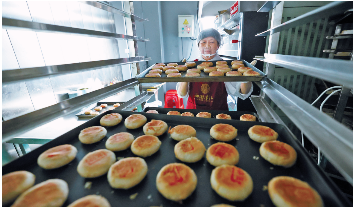
浙江老字号“西周芳记”车间工人正在制作月饼。