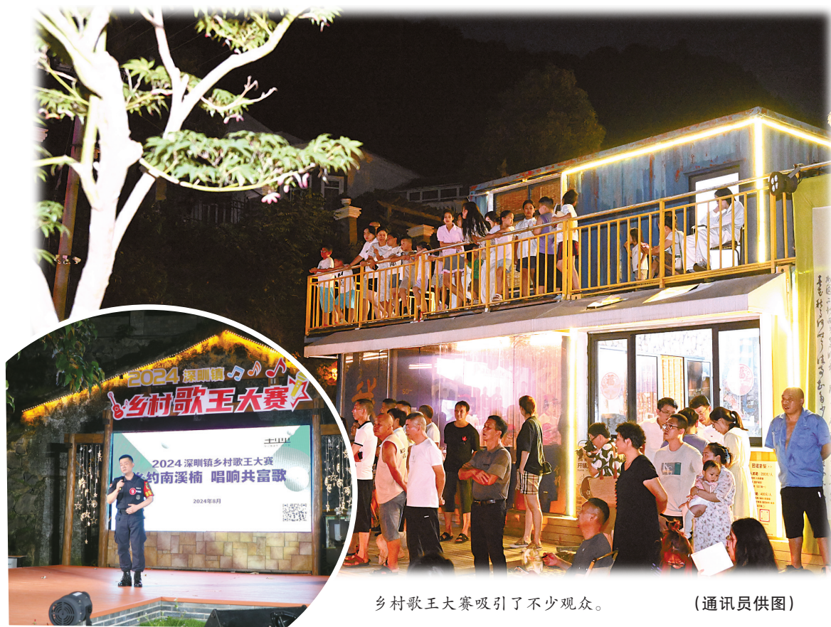
乡村歌王大赛吸引了不少观众。

“南溪楠小院”原本是一片闲置近20年的破旧宅基地。当地通过闲置土地置换、废旧老宅再利用等方式，结合当地特色人文风景、