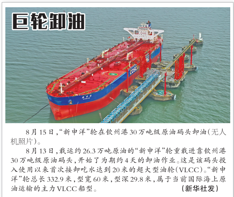
巨轮卸油 8月15日，“新中洋”轮在钦州港30万吨级原油码头卸油(无人照片)。 8月13日，载运约26.3万吨原油的“新中洋”轮重载进靠钦州港30万吨级原油码头，开始了为期约4天的卸油作业。这是该码头投入使用以来首次接卸吃水达到20米的超大型油轮(VLCC)。“新中洋”轮总长332.9米，型宽60米，型深29.8米，属于当前国际海上原油运输的主力VLCC船型。

回落0.3个百分点；扣除房地产开发投资，全国固定资产投资增长8%。 货物进出口较快增长，贸易结构继续优化。7月份，货物进出口总额36758亿元，同比增长6.5%，比上月加快0.7个百分点。其中，出口21389亿元，增长6.5%；进口15369亿元，增长6.6%。进出口相抵，贸易顺差6019亿元。 就业形势总体稳定，居民消费价格和回升。1至7月份，全国城镇调查失业率平均值为5.1%，比上年同期下降0.2个百分点。7月份，全国城镇调查失业率为5.2%，比上月上升0.2个百分点，比上年同月下降0.1个百分点。7月份，全国居民消费价格指数(CPI)同比上涨0.5%，涨幅比上月扩大0.3个百分点；环比上涨0.5%。