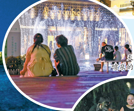
天一广场观看喷泉的市民。