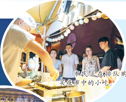
市民正在排队购买夜市中的小吃。