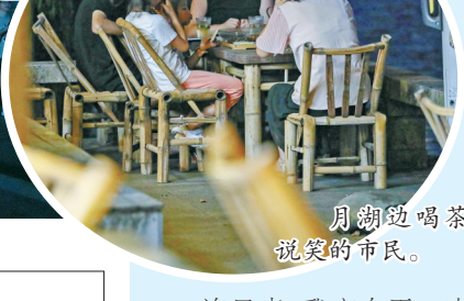
月湖边喝茶说笑的市民。