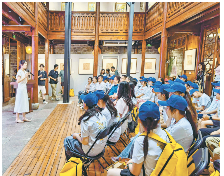
启动仪式现场。

接下来的几天,40多名青少年还将前往宁波博物馆、中国港口博物馆、梅山湾、宁波海洋研究院、王升大博物馆、黄古林草编博物馆、上林湖越窑青瓷博物馆、鸣鹤古镇、半浦村、庆安会馆等地研学,通过实地考察与亲身体验,全面而深入地了解宁波的历史文化、自然风光与现代社会成就。