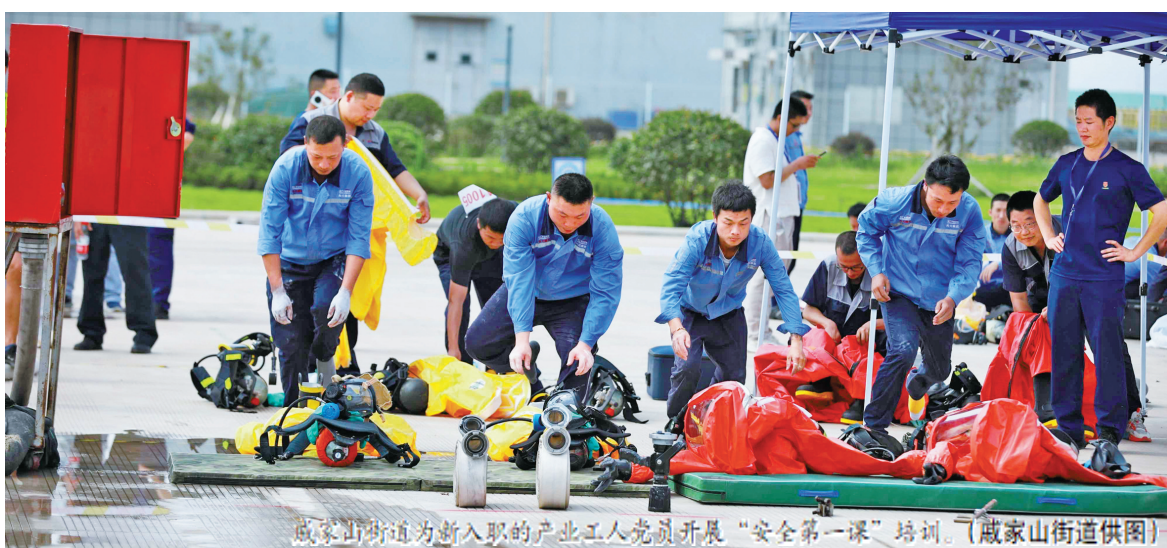
戚家山街道为新入职的产业工人党员开展“安全第一课”培训。

近一年来，戚家山街道的“花式充电”计划取得了显著成效。据统计，已有100余名产业工人党员通过学习培训取得了高中学历，20余名党员取得了大专以上学历。同时，还培养出15名专项技