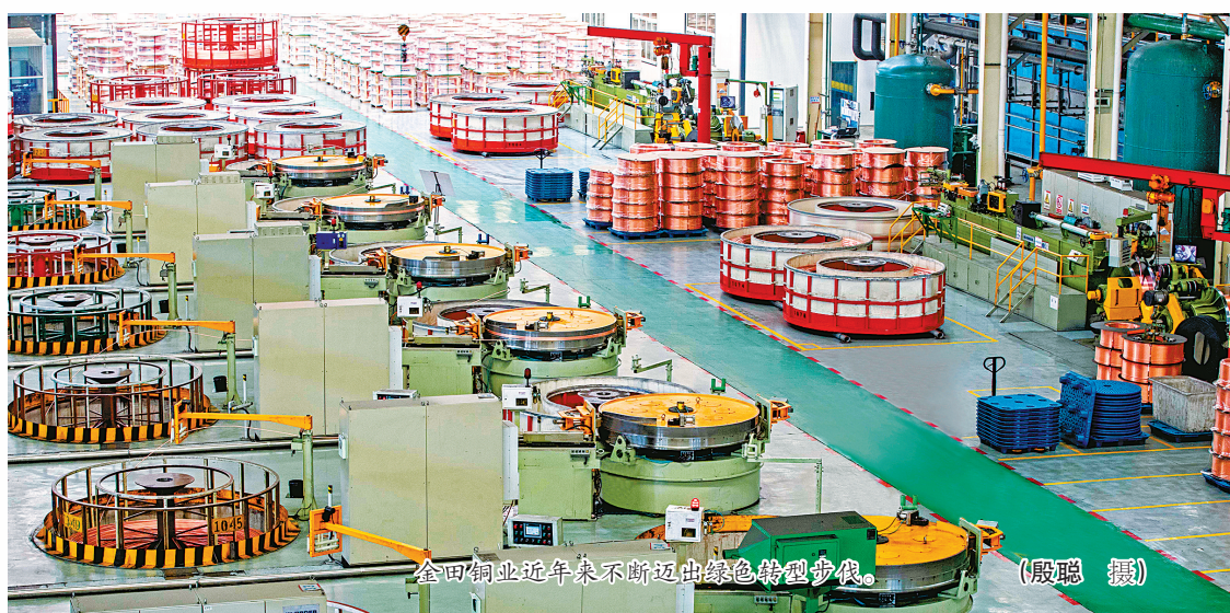
金田铜业近年来不断迈出绿色转型步伐。