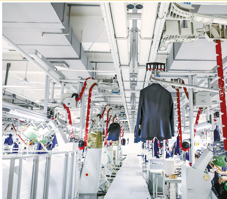
雅戈尔智能化生产已成主流。