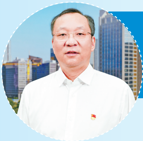
市委常委、鄞州区委书记沈敏