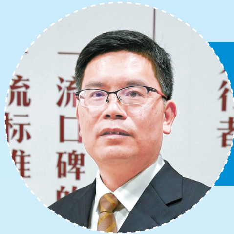
市委改革办常务副主任、 市营商环境建设局局长刘兴景。