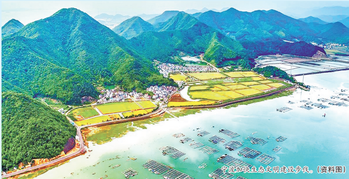
宁波加快生态文明建设步伐。(资料图)