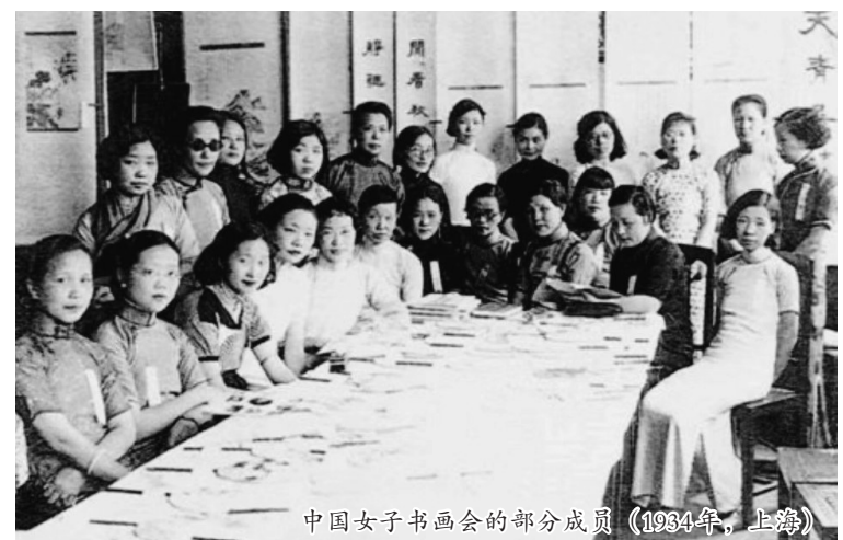
中国女子书画会的部分成员 (1934年，上海)

1956年8月，上海中国画院成立，聘请李秋君等69位画家担任画院第一批专业画师。她又重拾彩笔，绘画的才华犹如开闸的洪流喷薄而出。其中花卉人物画《梨花仕女》以没骨法笔触画出一