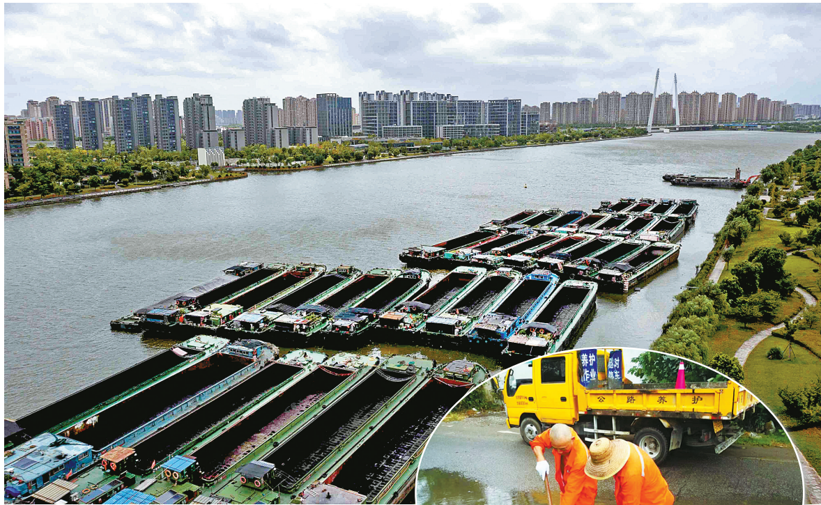
▲停靠在姚江上的船舶。

连续强降雨，导致姚江、甬江水位持续增高，姚江大坝持续排水，杭甬运河内河船舶通行风险加大。