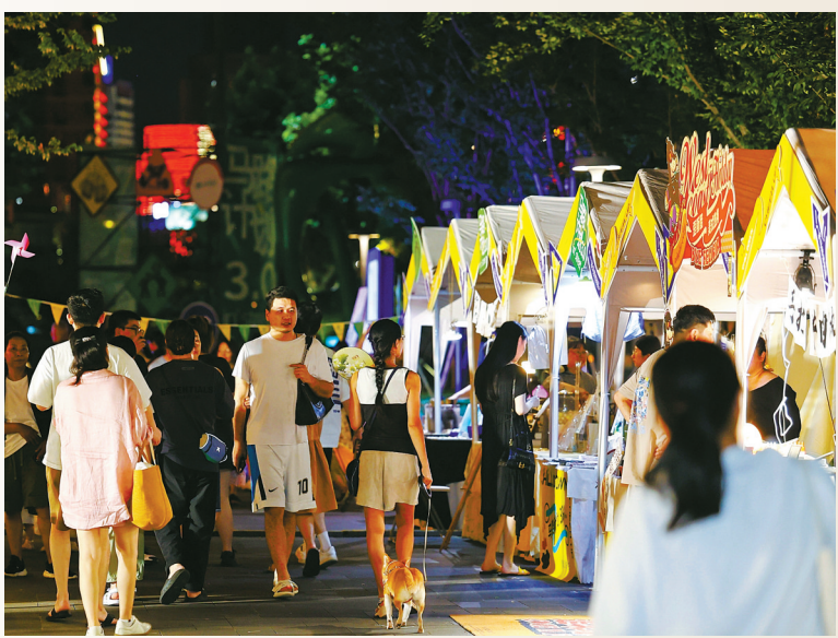
在宁波，市集摊位精致化、摊主年轻化、商品时髦化。