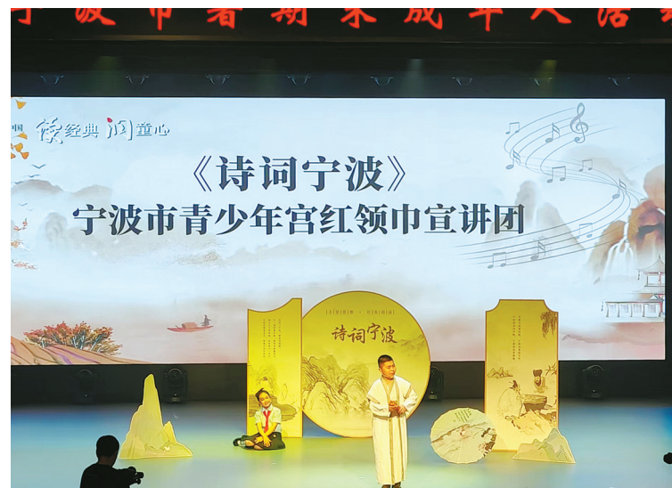
《诗词宁波》诵读表演。

本报讯（记者吴向正）书香润童年，阅读伴成长。昨天下午，2024年宁波市暑期未成年人“读经典 润童心”活动启动仪式在海曙区青少年宫举行，一系列丰富多彩的活动由此拉开帷幕。