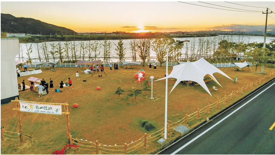
象山大唐港旅游驿站。

位于象山县新桥镇的西海岸旅游驿站则注入了运动元素。“驿站打造了下沉式广场、音浪舞台等新场景，游客可以在广场体验滑板、轮滑、飞盘等户外运动项目。”象山文化和广电旅游体育局有关负责人介绍。此外，游客在驿站还可徒步、骑行、观湖观赛、跑马拉松等。截至目前，驿站及配套区域接待游客超20万人次。