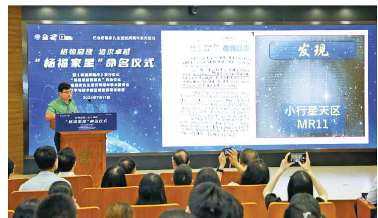
国家天文台研究员邹虎介绍“杨福家星”的发现过程和轨道运行情况。

本报讯(记者黄合 通讯员周婉军)记者昨天从宁波诺丁汉大学了解到,国家天文台发现的国际编号为85728号的小行星,经国际小行星委员会批准,正式以我国著名物理学家、教育家、宁波诺丁汉大学原校长杨福家的名字命名。 昨天,在上海举行的“杨福家星”命名仪式上,国家天文台台长、党委副书记刘继峰致贺词并宣读了“杨福家星”国际命名公报和命名证书。国家天文台小行星命名委员会精心挑选了第85728号小行星,其最后3个数字“728”正是杨福家先生的生日。 据悉,小行星是目前各类天体中唯一可以根据发现者意愿进行提名并经国际组织审核批准从而得到国际公认的天体。在此之前,“邵逸夫星”“王宽诚星”“曹光彪星”“李达三星”“贝时璋星”“谈家桢星”“吴祖泽星”“贺贤土星”等,都在浩瀚的星海中留下了“宁波帮”人士的闪亮身影。 杨福家祖籍宁波镇海。