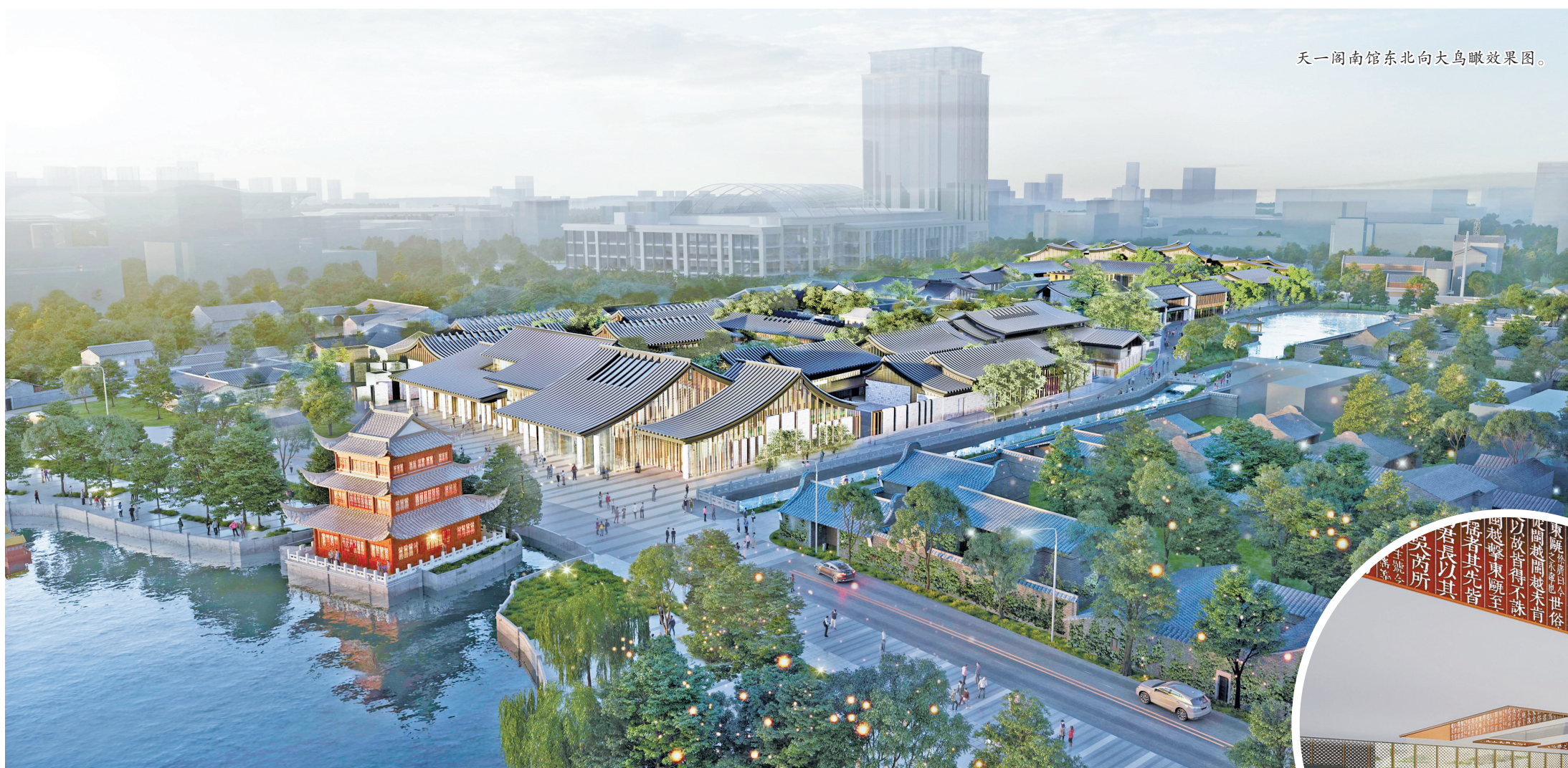
天一阁南馆东北向大鸟瞰效果图。