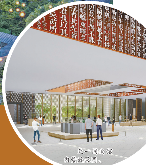
天一阁南馆内景效果图。