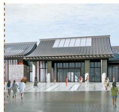
天一阁南馆东侧入口效果图。