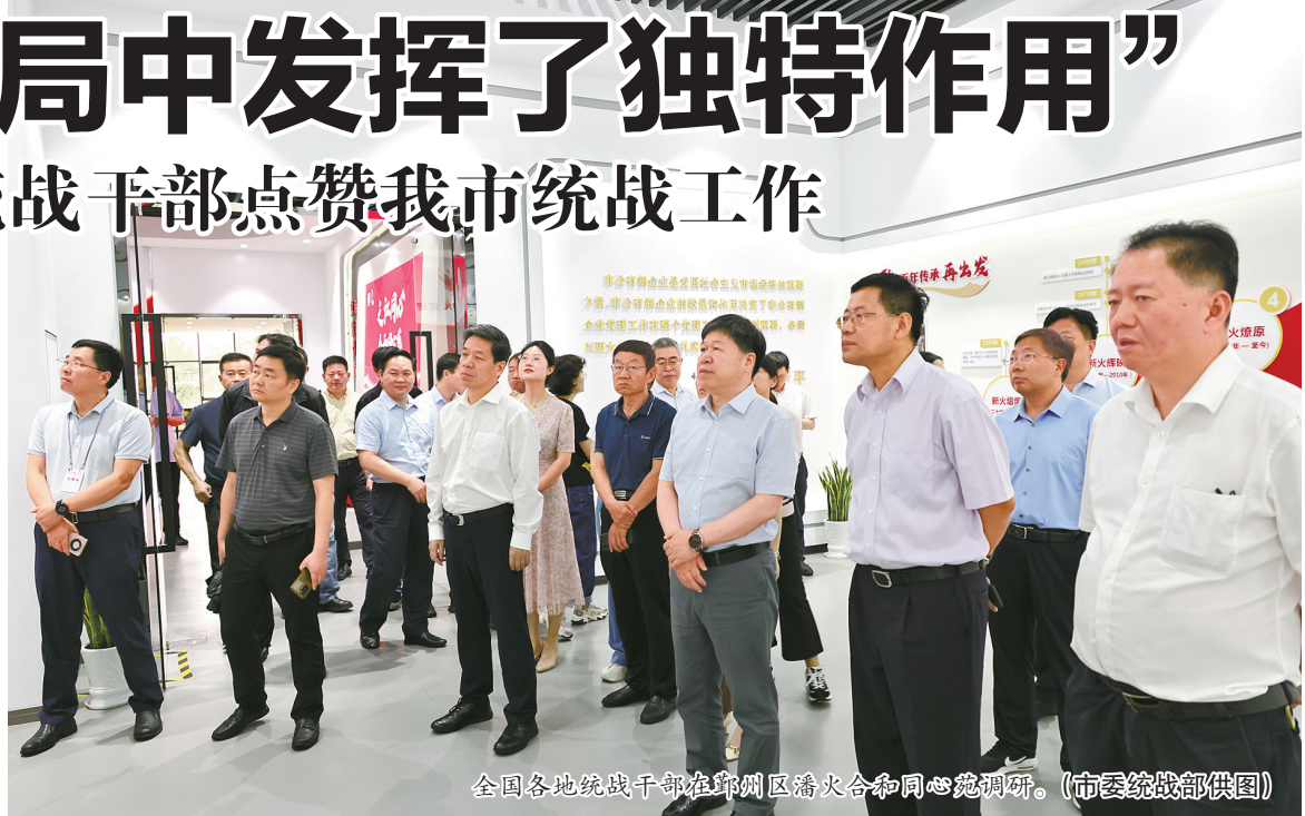
全国各地统战干部在鄞州区潘火合和同心苑调研。

好、考察点位好，收获满满，受益颇丰，浙江省和宁波市的统战工作一直走在全国前列，勇于创新、亮点纷呈，工作做得好体现在方方面面。特别是进入新时代以来，宁波统一战线充分发挥独特优势，围绕中心抓落实，聚集主业明责任，统筹管理激活力，实干推进敢创新，同心协力促发展，为宁波经济社会发展凝聚人心、汇聚力量，取得了明显成效，值得学习，值得点赞。