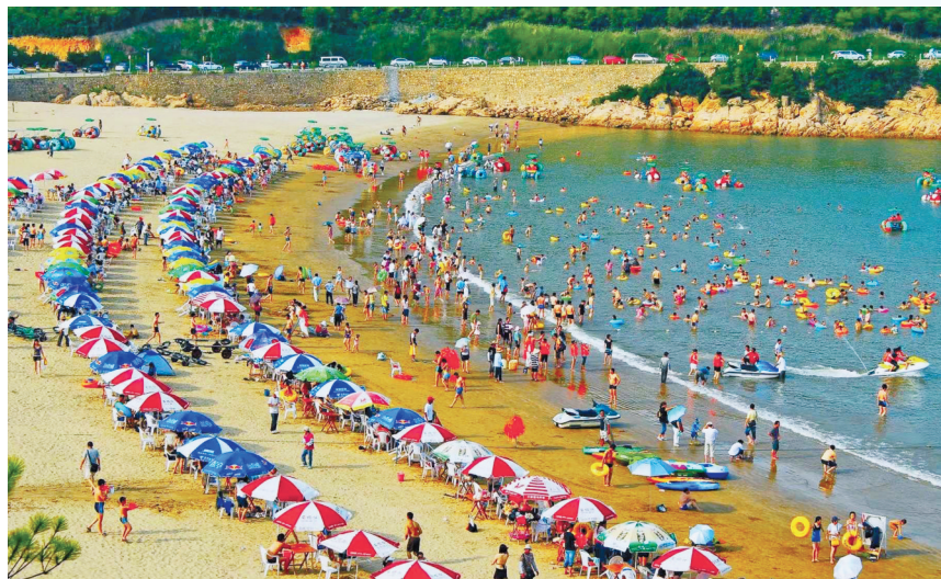
松兰山旅游度假区。