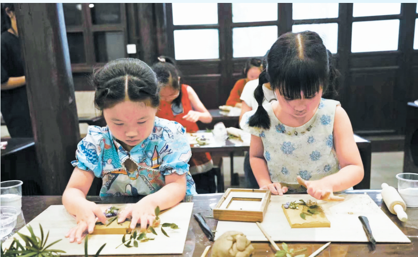
天一阁博物院“古阁小书生”暑期研学活动。

游三江六岸，看“宁波十景十线”“明州十景十线”，游客可沉浸式体验三江六岸夜经济示范带灯光秀、“海港新秀”梦幻灯光秀、“夏月泛舟浮生梦——宋韵水上夜游”等新夜景。