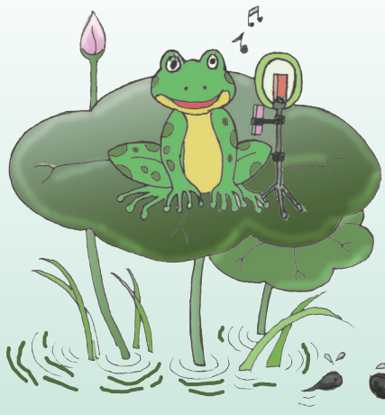
小蝌蚪找妈妈 宋旭升 绘