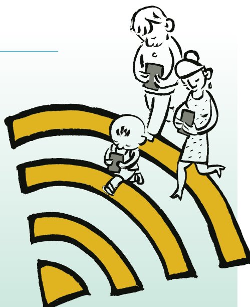
“专注” 张爱学 绘