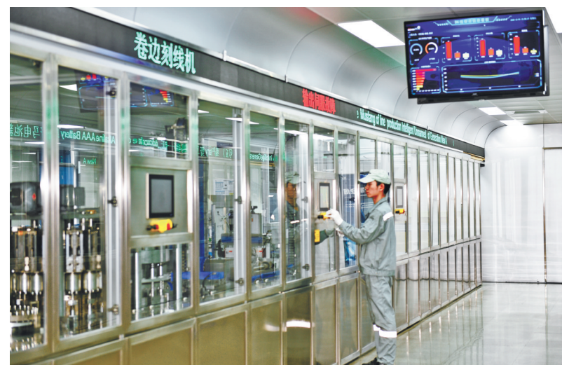
野马电池智能化生产线。

新一轮“两新”行动，既是扩大消费的契机，又是企业升级的良机。把握“两新”机遇，推动宁波产业提能升级，为全市高质量发展注入强劲动力。