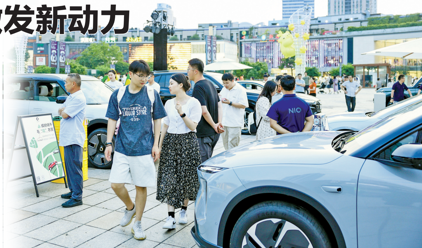
端午假期的广场车市。