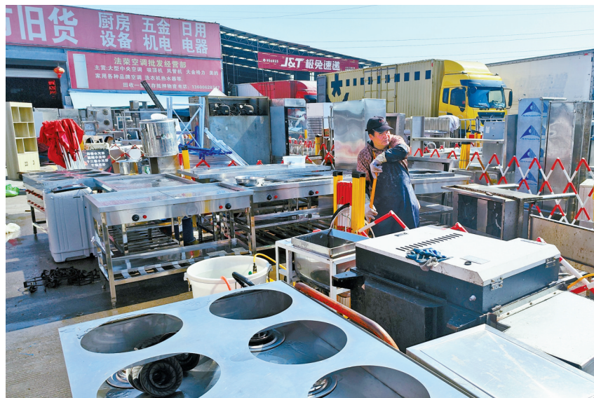
旧货市场工人正在清理厨房设备。