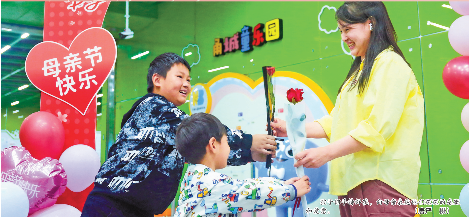
孩子们手持鲜花,向母亲表达他们深深的感激和爱慕。