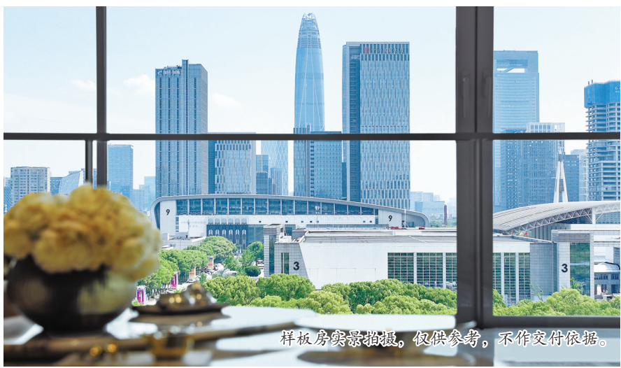
样板房实景拍摄,仅供参考,不作交付依据。

一高楼宁波中心、金融硅谷、中央公园等星罗棋布,保利·海晏天珺就处于这条轴线的北端,拥有了“大隐隐于市”的深邃与幽静。