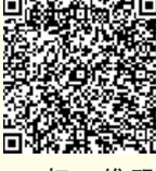
扫二维码，看甬派相关视频访谈。

祝贺宁波能拥有这么一支高水准的专业级乐团，期待乐团在继续加强与国际知名演奏家、乐团以及音乐机构交流合作的同时，社会各界给予宁波交响乐团更多的关注和支持。无论是政府、媒体还是观众，都应该给予他们更多的时间和空间，把他们打造成中国一流、世界有名的乐团。