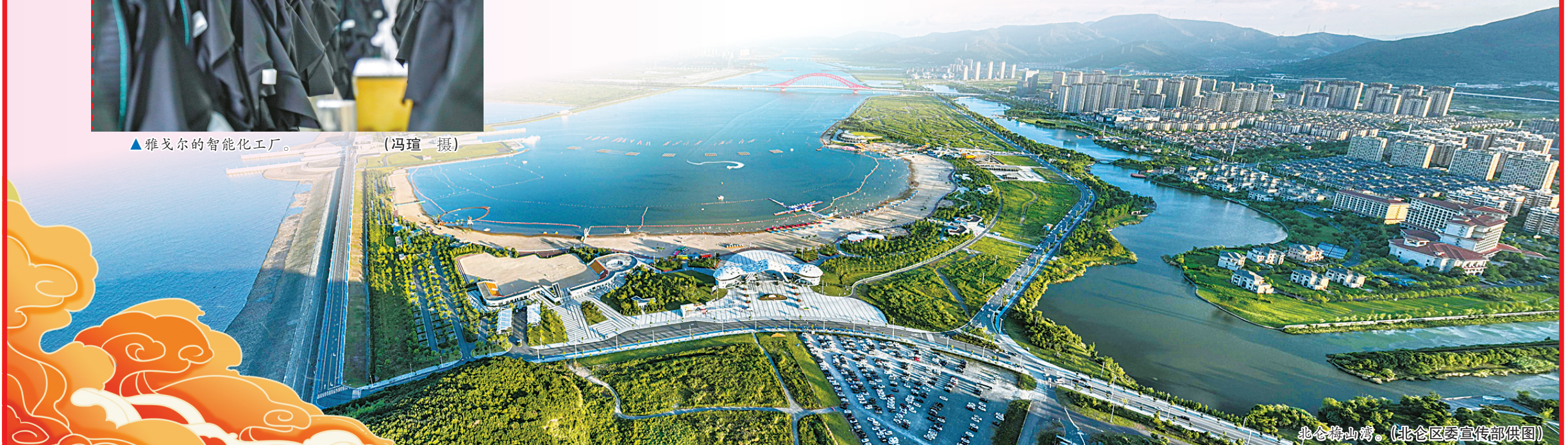
北仑梅山湾。

这是民企创新的切面，是宁波向上的征途。从更长的时间维度来审视，看似困难的世界500强“零的突破”，可能只是宁波的一个插曲、一个瞬间。