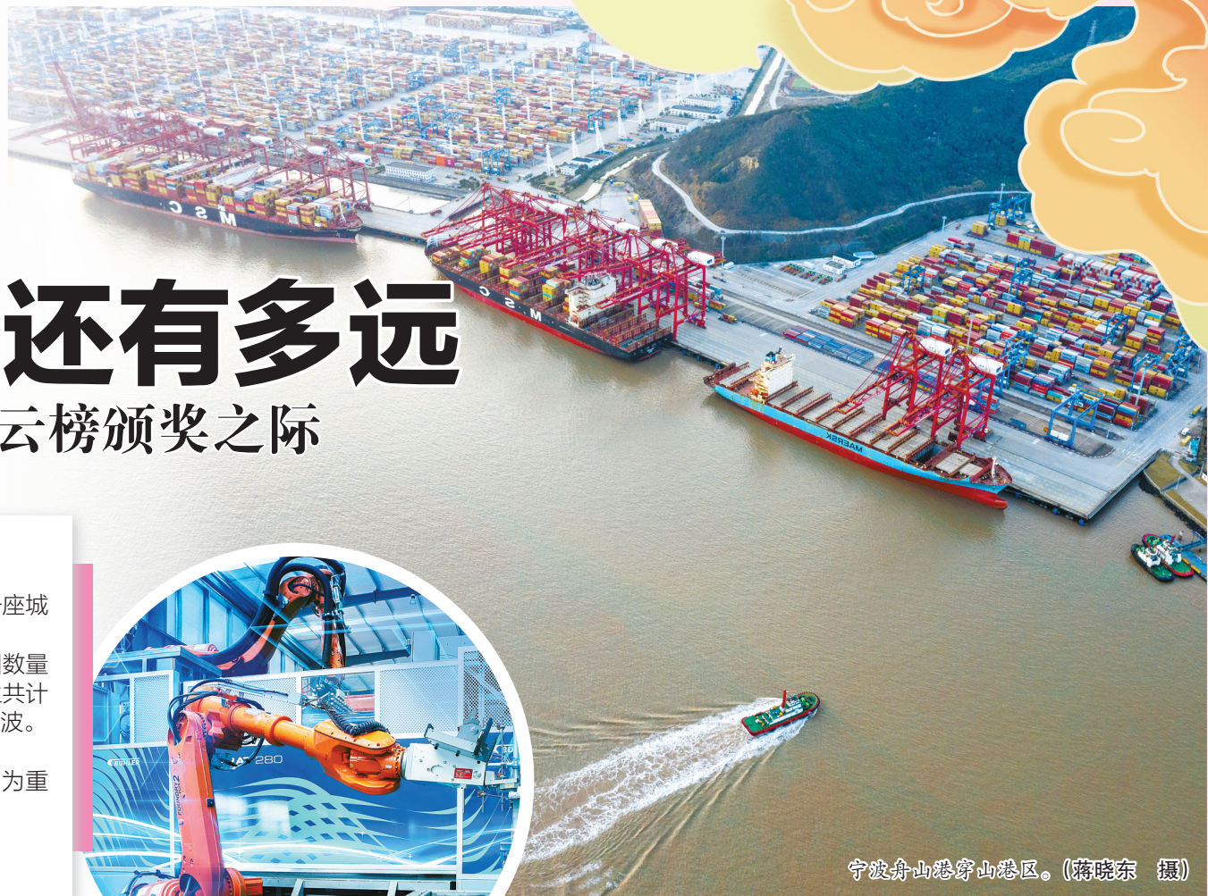
宁波舟山港穿山港区。

素以制造业见长的宁波，始终未能实现世界500强“零的突破”。昨天上午，在年度创业创新风云榜颁奖仪式上，宁波以“大优强、绿新高”为重点，集中表彰了一批具有引领性、导向性、标志性的企业和单位。那么问题来了：这批宁波“大优强”，离世界500强还有多远？