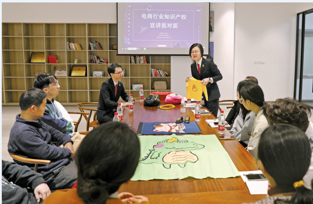
在余姚阳明电子商务产业园，共话电商行业知识产权保护。

保护知识产权就是保护创新，保护创新就是服务加快发展新质生产力。新时代，新征程，如何优化司法供给，更好地支撑和服务新质生产力发展？